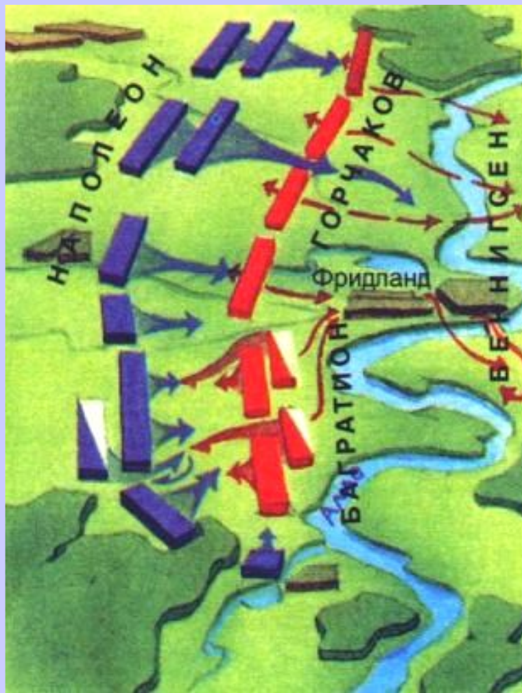
Битва под Фридландом

В 1806г. Возникла 4-я коалиция-Россия, Англия, Швеция, Пруссия.