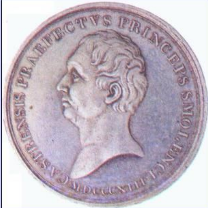
Т.Холидей.Медаль В честь М.И.Кутузова.

К несчастью, находясь в Пруссии, М.Кутузов простудился и несмотря на все усилия врачей 28 апреля скончался.