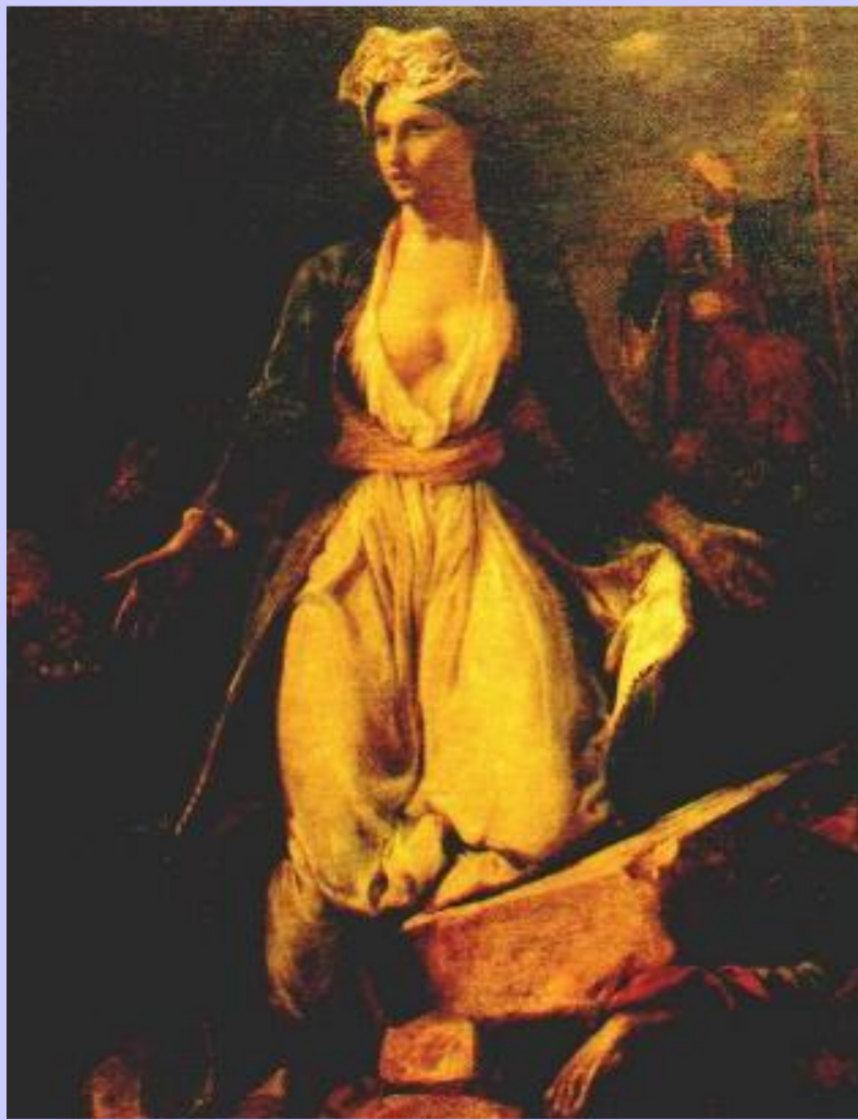
Э.Делакруа. Греческая революция

В к. 20-х г. Союз распался из-за противоречий по Восточному вопросу.