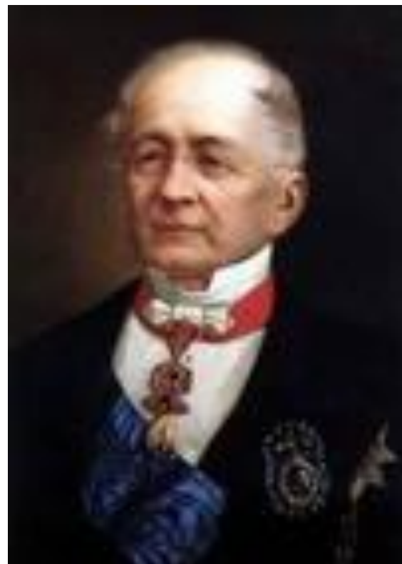
А. М. Горчаков

1) Используя противоречия между государствами, на международной конференции в Лондоне в 1871г. Россия получила разрешение строить крепости на Черном море и иметь там флот ( 1856г. -министр иностранных дел А. М. Горчаков, лицейский друг Пушкина, один из блестящих русских дипломатов, внешняя политика-"собрание сил").