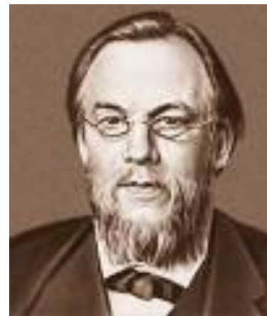
С. П. Боткин