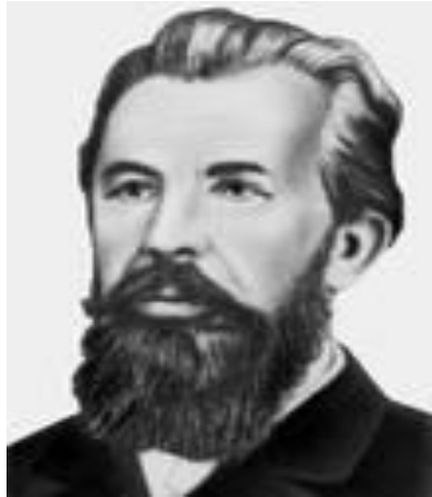
Н. В. Склифосовский

Общественные движения в России в защиту славяно-добровольцы, пожертвования, Александер II внес 10 тыс., хирург Н. В. Склифосовский возглавил санитарные отряды в Черногории, врач С. П. Боткин в Сербии.