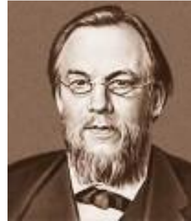
С. П. Боткин