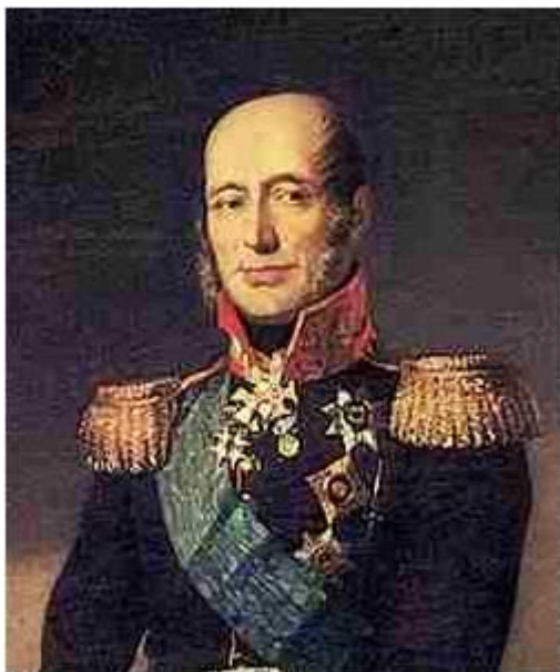
Барклай де Толли Михаил Богданович