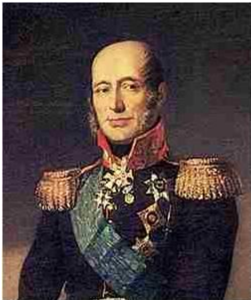
Барклай де Толли Михаил Богданович