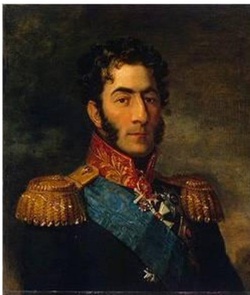
Багратион Петр Иванович