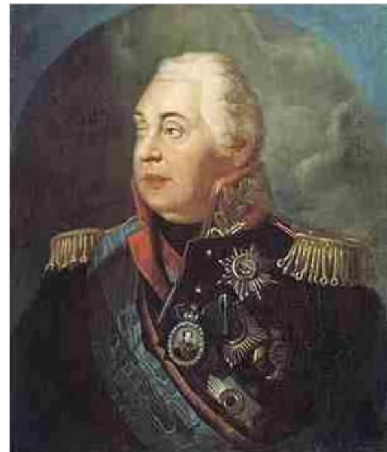
Кутузов Михаил Илларионович

8 августа 1812 г. – указ императора о назначении главнокомандующим русской армией М.И. Кутузова.