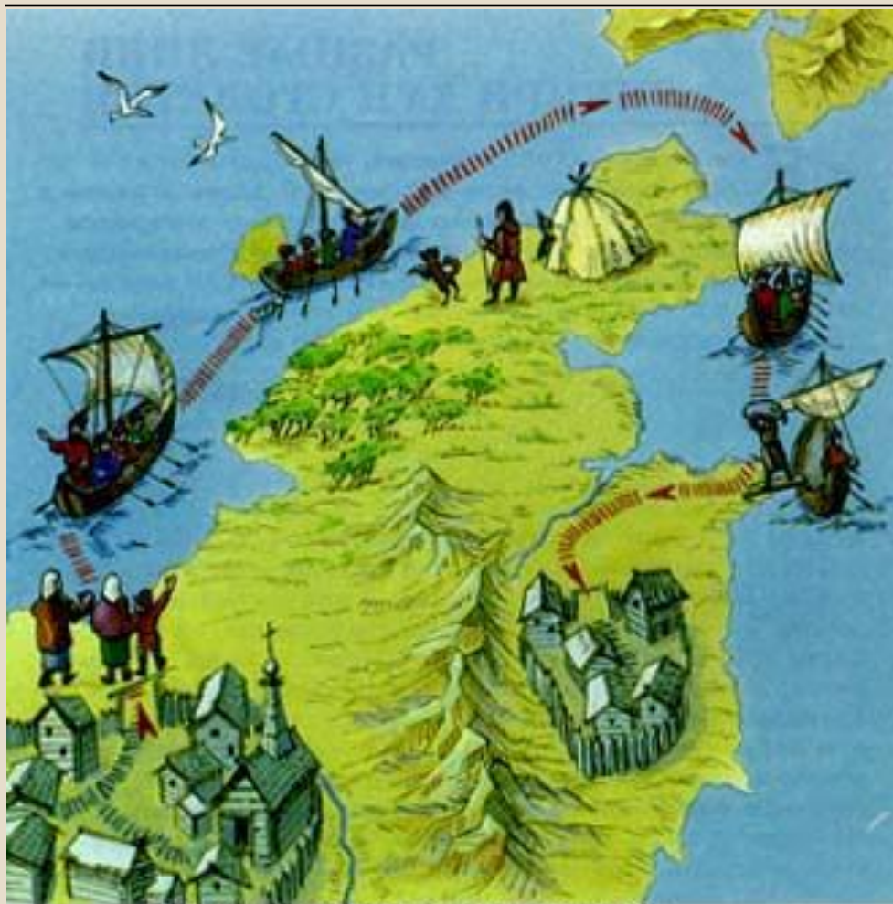
Путешествие Семена Дежнева

Впервые пройдя проливом отделяющим Америку от Азии, Дежнев основал Анадырский острог. В 1649-53 гг. в результате походов Е. Хабарова были составлены подробные карты Амура. Нерчинский договор 1689 г. установил границы между Россией и Китаем.