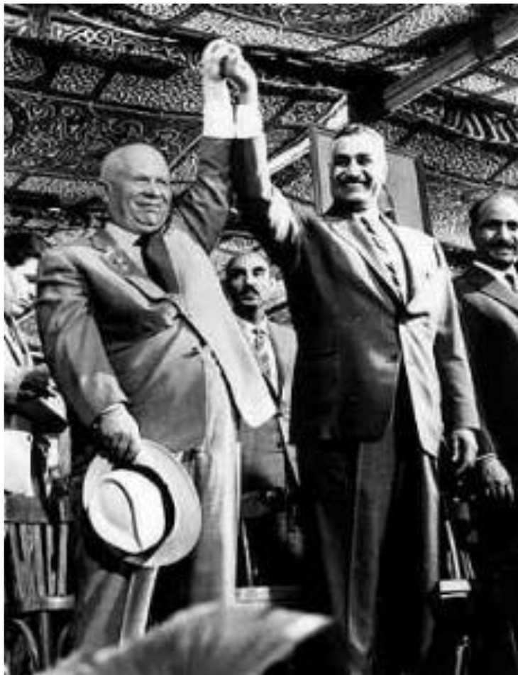
Н.С.Хрущев и Г.А.Насер.

Укреплялись отношения со странами-лидерами Движения-Индией, Индонезией, Египтом. Их руководители нанесли визиты в СССР, им оказывалась военная и экономическая помощь. СССР поставлял оружие в страны Азии, Африки, Латинской Америки. При его поддержке Египет национализировал Суэцкий канал, Индонезия освободила о. Тимор. В ответ США начали поддержку Израиля и Пакистана. Это привело к новым конфликтам.