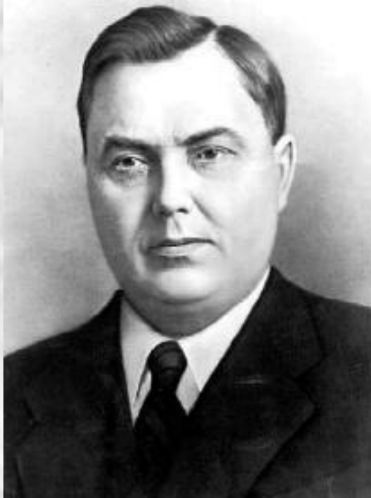
Г. М. Маленков.

Иначе оценивал ситуацию Г. М. Маленков. Видя реальную опасность, которую таит в себе ядерное оружие, Г. Маленков не только выступал за мирное сосуществование, но и считал его в ядерный век единственно возможной основой межгосударственных отношений. В марте 1954 г. Маленков заявил, что «война в современных условиях означает гибель мировой цивилизации». Хотя он и был отстранен от политического руководства. Н.С. Хрущев в отношении политики «мирного сосуществования» разделял его позицию. Однако все руководители понимали, что будущее СССР зависит от развития отношений с Западом.