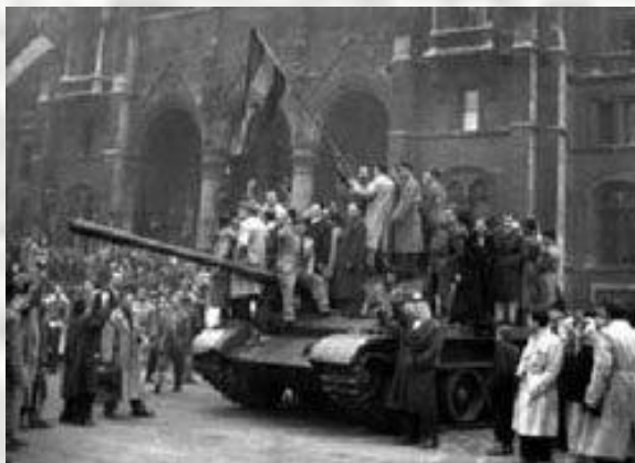
Советские танки на улицах Будапешта

Особенно сильны были антисоветские настроения в Польше и Венгрии. Многотысячные демонстрации требовали «Свободы!», «Долой коммунизм!», «Бога!», «Хлеба!». В отношении Польши кризис удалось преодолеть мирным путем. Согласившись признать лидером ПОРП (Польской Объединенной рабочей партии) популярного в обществе В. Гомулку, советские власти несколько ослабили контроль над политической жизнью Польши и отозвали в Москву назначенного в 1945 г. министром национальной обороны Польши советского маршала К.К. Рокоссовского .