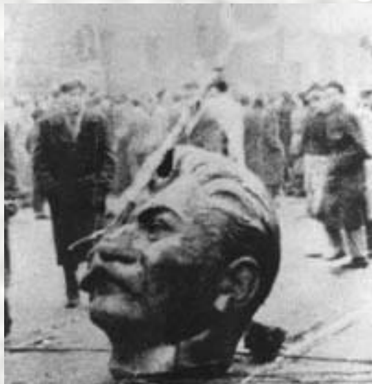
Символ Венгерского восстания – уничтожение памятника Сталину