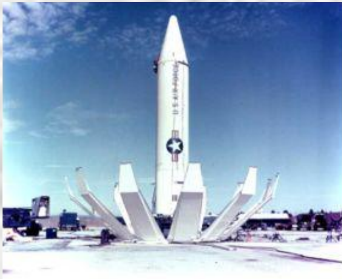
Ракета средней дальности США «Юпитер»

В августе 1963 г. лидеры СССР и США поставили свои подписи под договором о запрещении испытаний ядерного оружия в атмосфере, под водой и в космосе. Был сделан первый шаг на долгом пути к запрещению ядерного оружия. В начале 1964 г. был опубликован меморандум Советского правительства «О мерах, направленных на ослабление гонки вооружений и смягчение международной напряженности». Несмотря на значительное улучшение отношений с Западом и многочисленные инициативы по разоружению, Хрущев понимал «мирное сосуществование» как новую форму борьбы, соперничества двух систем («...Догнать и перегнать Америку!»), в котором допустимы любые методы. Поэтому говорить о взаимовыгодном и долгосрочном сотрудничестве в тот период нельзя.