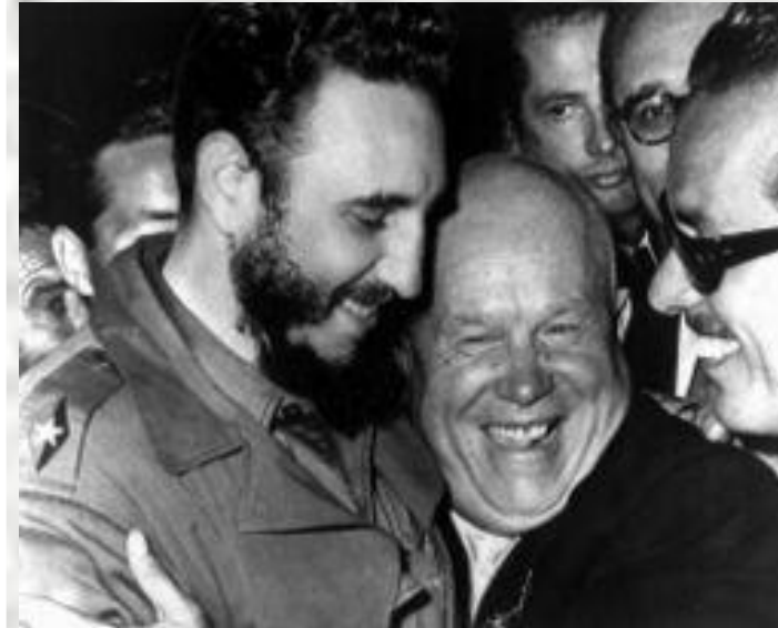
Ф.Кастро и Н. Хрущев

В октябре 1961 г. Н.С. Хрущев объявил о том, что СССР в одностороннем порядке отказывается от моратория на ядерные взрывы в атмосфере. Вершиной этой конфронтации стал Карибский кризис 1962 г. Карибский кризис, поставивший мир на грань ядерной войны, был вызван размещением советского атомного оружия на Кубе. Ответной мерой президента Дж.Ф. Кеннеди В октябре 1961 г. Н.С. Хрущев объявил о том, что СССР в одностороннем порядке отказывается от моратория на ядерные взрывы в атмосфере. Вершиной этой конфронтации стал Карибский кризис 1962 г. Карибский кризис, поставивший мир на грань ядерной войны, был вызван размещением советского атомного оружия на Кубе. Ответной мерой президента Дж.Ф. Кеннеди стала военно-морская блокада Кубы и требование вывести советские ракеты с острова. В боевую готовность были приведены не только вооруженные силы СССР и США, но и войска НАТО В октябре 1961 г. Н.С. Хрущев объявил о том, что