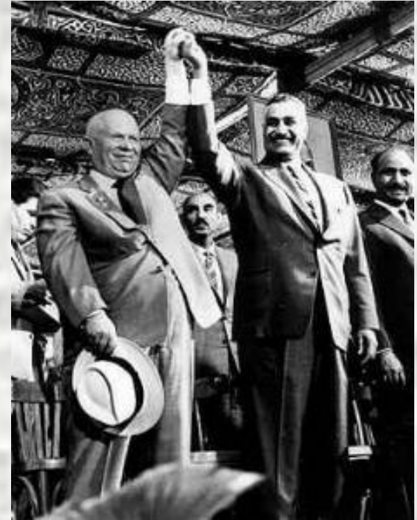
Н.С.Хрущев и Г.А. Насер.

Созданная в 1945 г. на севере Вьетнама ДРВ (Демократическая республика Вьетнам) во главе с Хо Ши Мином пользовалась всяческой поддержкой Советского Союза. С 1956 г. СССР выступил инициатором принятия в ООН целой группы молодых государств. Суэцкий кризис 1956 г., когда Великобритания и Франция поддержали израильскую агрессию в Египет, а Советский Союз своей твердой позицией в ООН добился отвода иностранных войск от Суэцкого канала, еще больше укрепил авторитет СССР среди развивающихся стран. В 1959 г. СССР поддержал революцию на Кубе (в 1961 г. лидер кубинской революции Ф. Кастро начал социалистические преобразования), а в 1961 г. — образование Движения Неприсоединения. Советские власти развивали политические и торговые контакты с Ираном, Сирией, Афганистаном, Индией, Египтом и другими молодыми государствами. А то правительство, которое объявляло об избрании «социалистического пути развития» могло рассчитывать на безвозмездную экономическую и военную поддержку СССР.