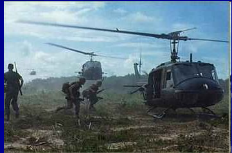
Армия США а Юж.Вьетнаме