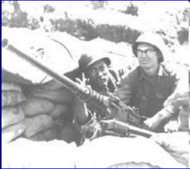
Американские солдаты в Корее