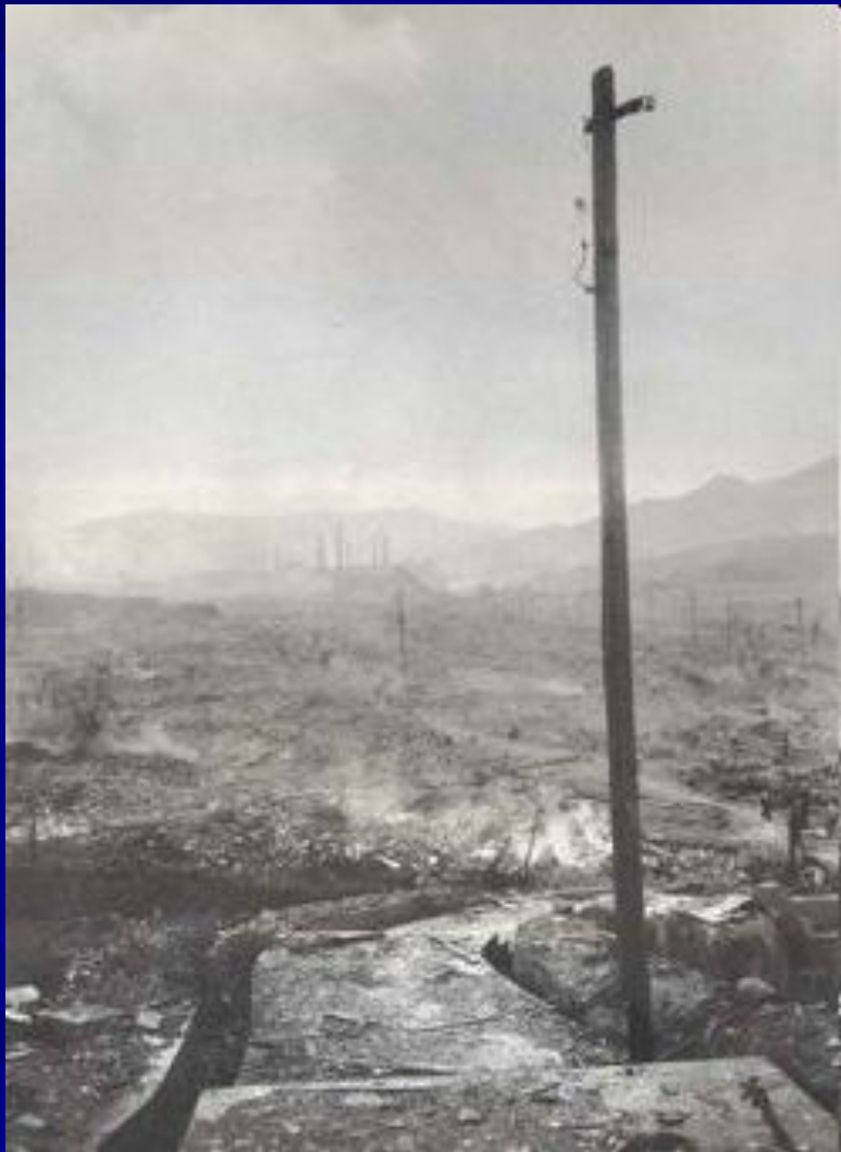
Нагасаки после ядерной бомбардировки