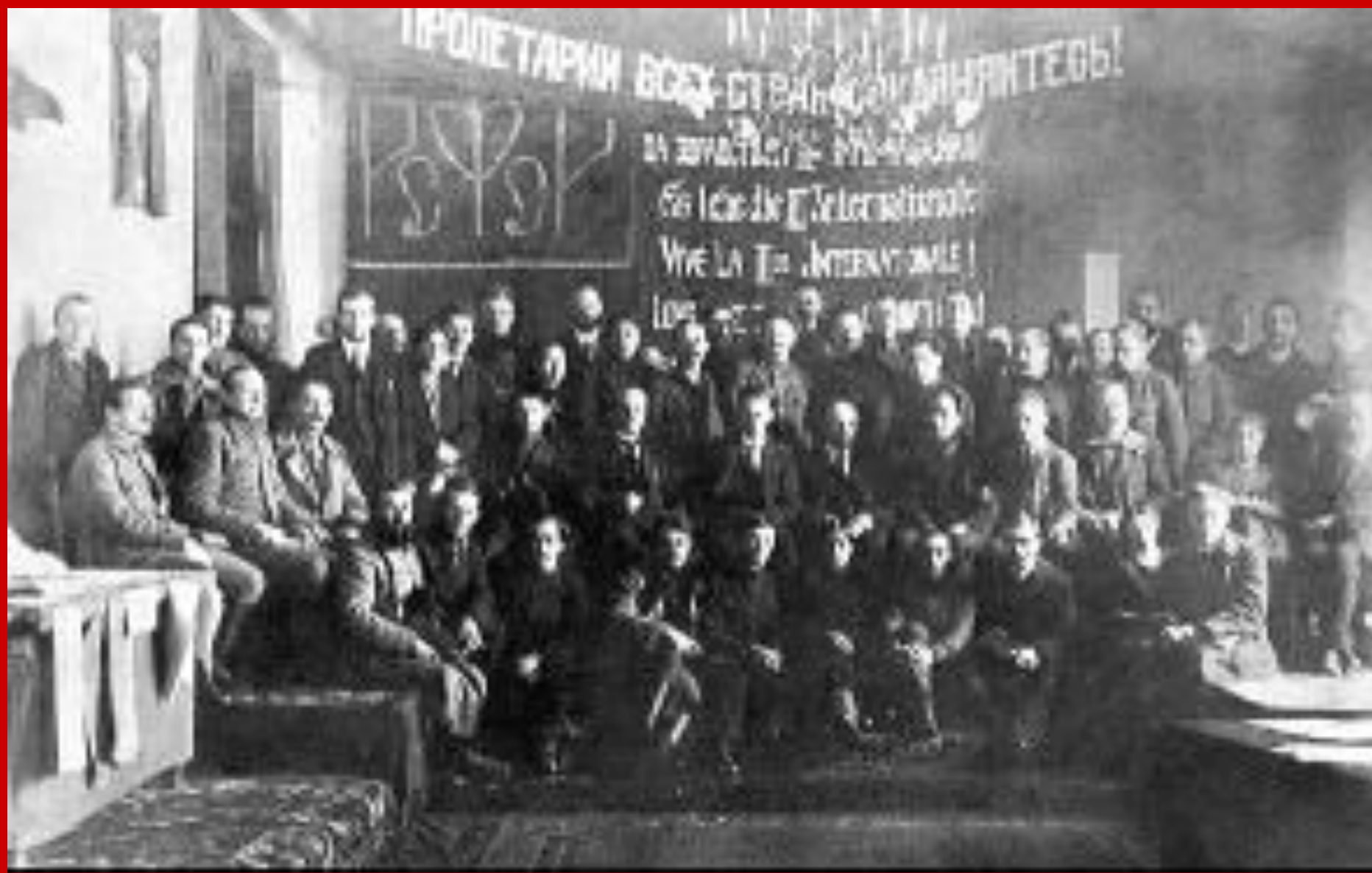
В.И.Ленин. Среди делегатов I конгресса Коминтерна.