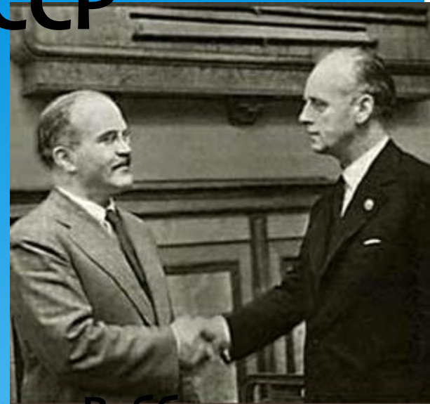
Молотов и Риббентроп