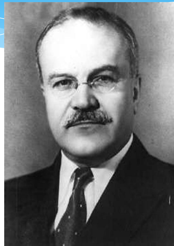
В.М.Молотов(Скрябин), С 1939 г.