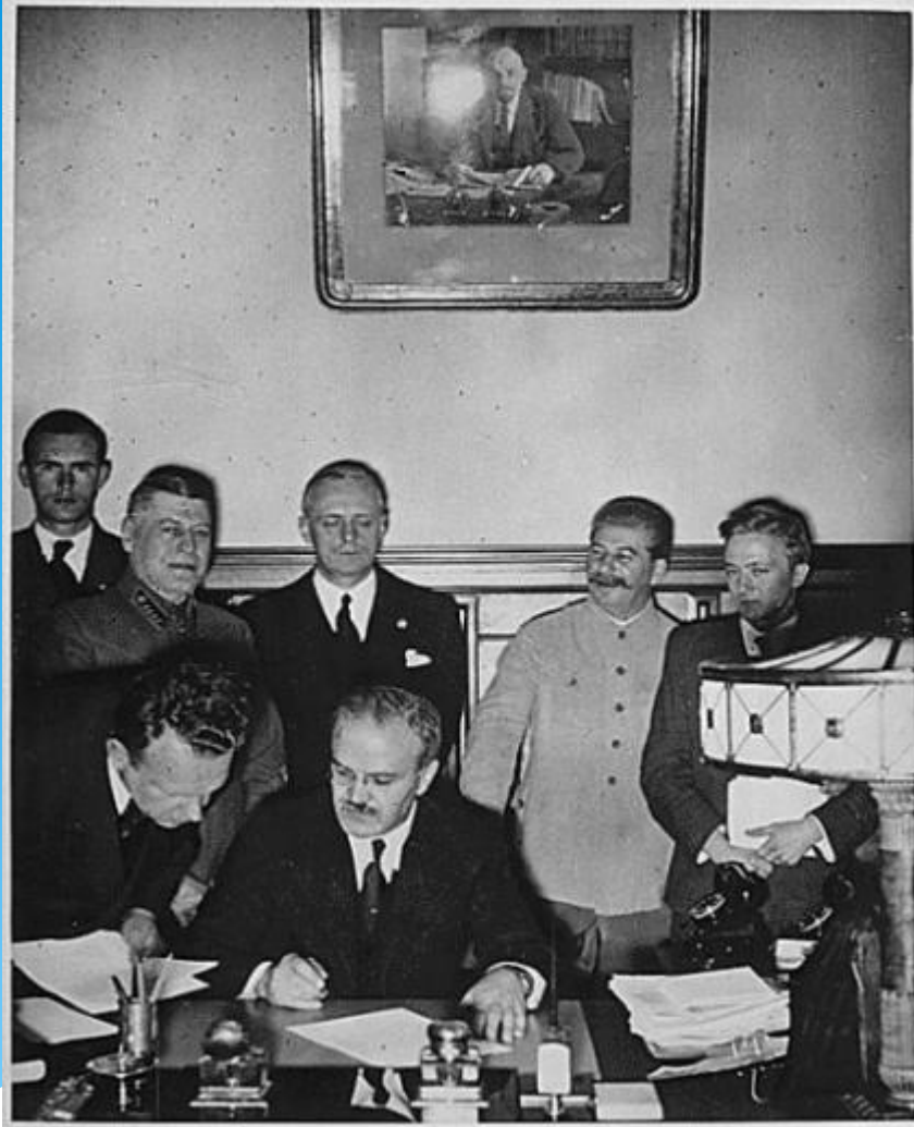
Подписание пакта о ненападении 23 августа 1939 г.