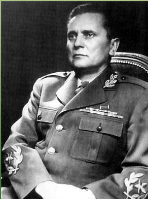
Иосип Броз Тито. 1945 год

начал борьбу с оппортунизмом в партиях Восточной Европы. Их лидеры были объявлены врагами а отношения с Югославией были разорваны.