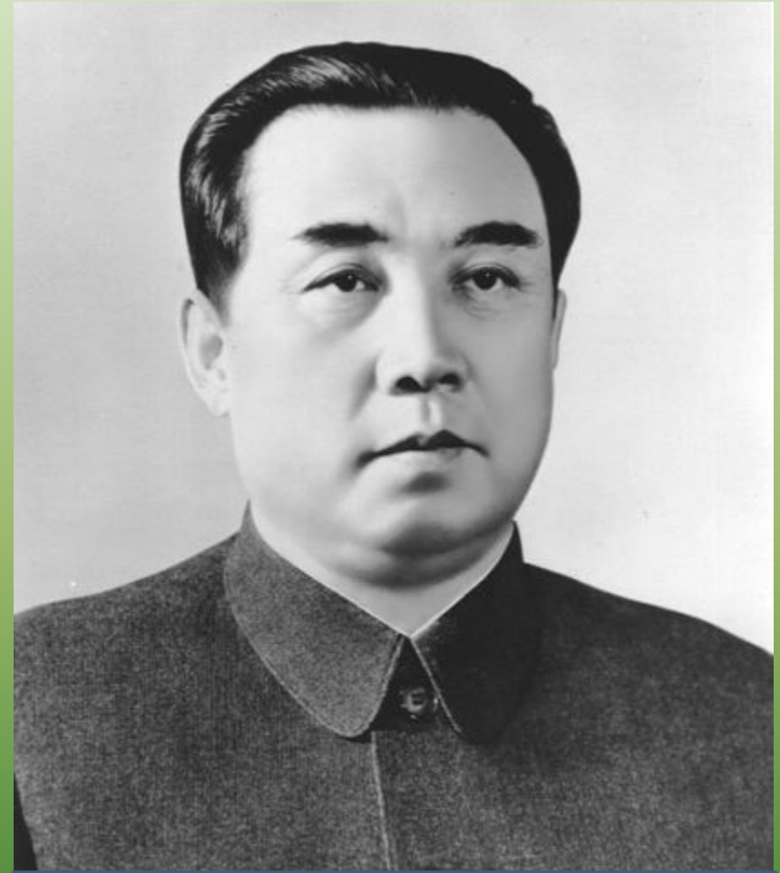
Ким Ир Сен

пропагандистские цели, так как каждая из сторон соглашалась на объединение государства только при установлении в другой части своего политического режима. В результате борьба между СССР и США за влияние в Корее переросла в открытую войну (1950 - 1953 гг.)