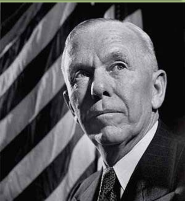
Джордж Кэтлетт Маршалл (1880—1959)

План Маршалла помог стабилизации европейской экономики, но закрепил деление мира на две части - Восток, Запад.