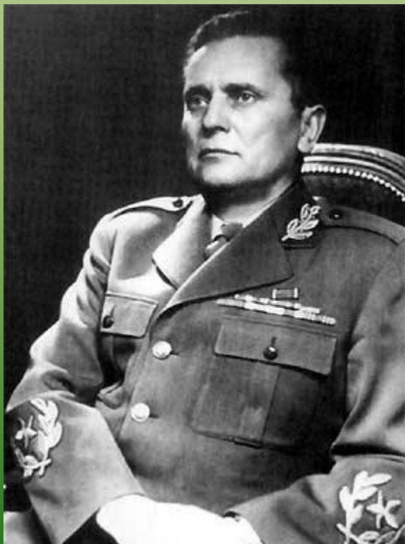
Иосип Броз Тито. 1945 год

начал борьбу с оппортунизмом в партиях Восточной Европы. Их лидеры были объявлены врагами а отношения с Югославией были разорваны.