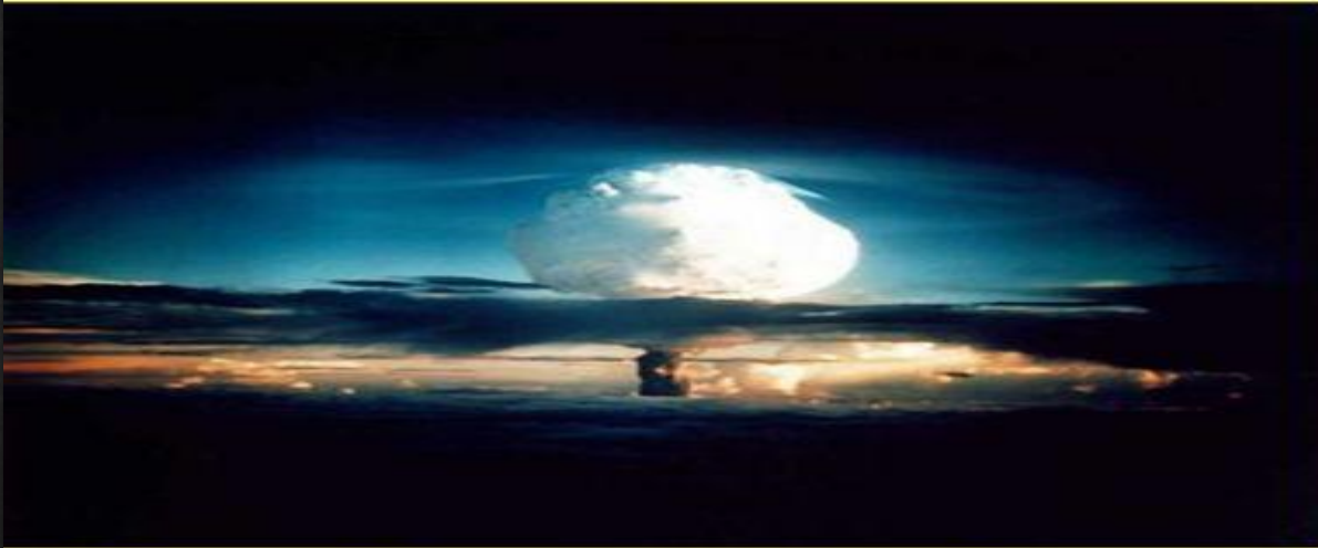
Ядерный взрыв на Новой земле. 1958 г.

Во второй половине 50-х гг. резко усилилась гонка вооружений между СССР и США. Осенью 1957 г. Москва предложила ввести мораторий на испытания ядерного оружия. В 1958 г. СССР в одностороннем порядке прекратил испытания.