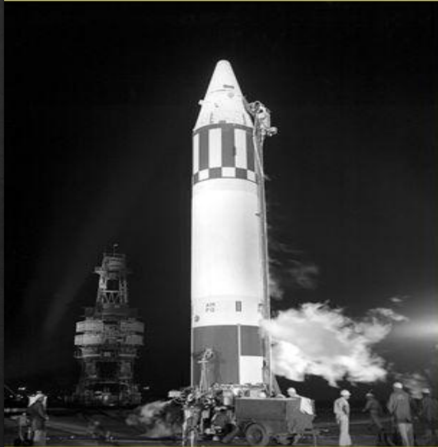
Американская баллистическая ракета PGM-19 Jupiter

В 1962 г. возник еще один, самый опасный с 1945 г., кризис в советско-американских отношениях.