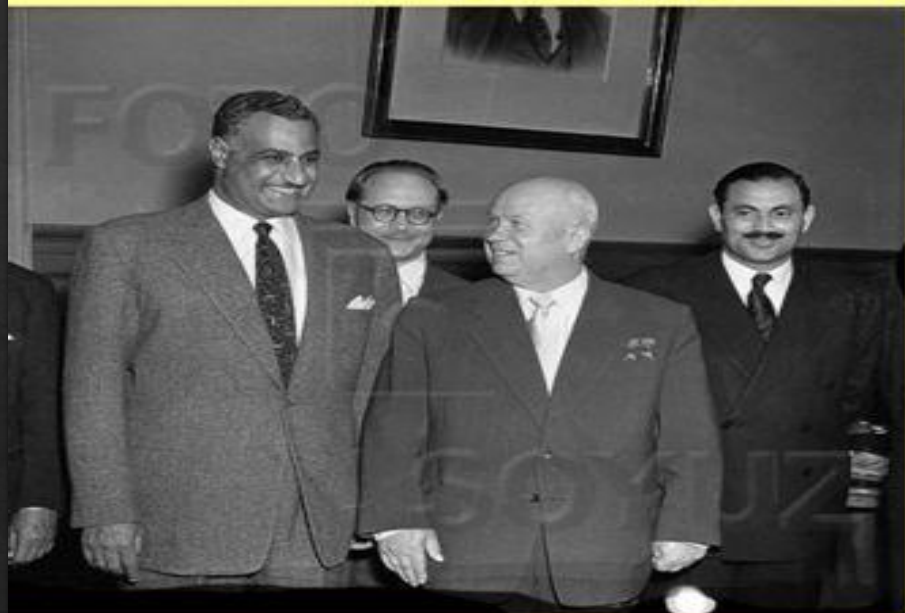
Гамаль Абдель Насер и Н.С. Хрущев в Москве 1958.

В поисках противовеса британскому влиянию на Ближнем Востоке Насер начал сближение с СССР.