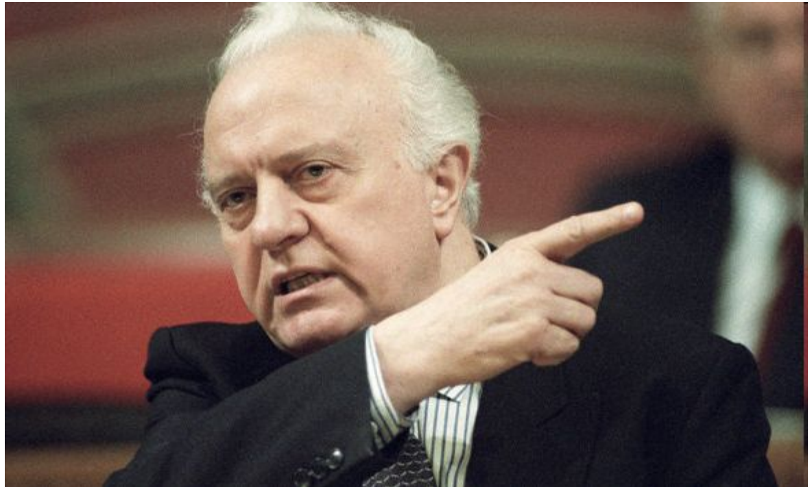
Эдуард Амвросиевич Шеварднадзе – министр иностранных дел СССР (1985-1990)

Последовало значительное обновление руководства МИДа