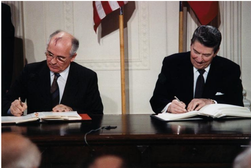
М. Горбачев и Р. Рейган подписывают Договор РСМД

Впервые от переговоров об ограничении вооружений две сверхдержавы перешли к ликвидации этого оружия