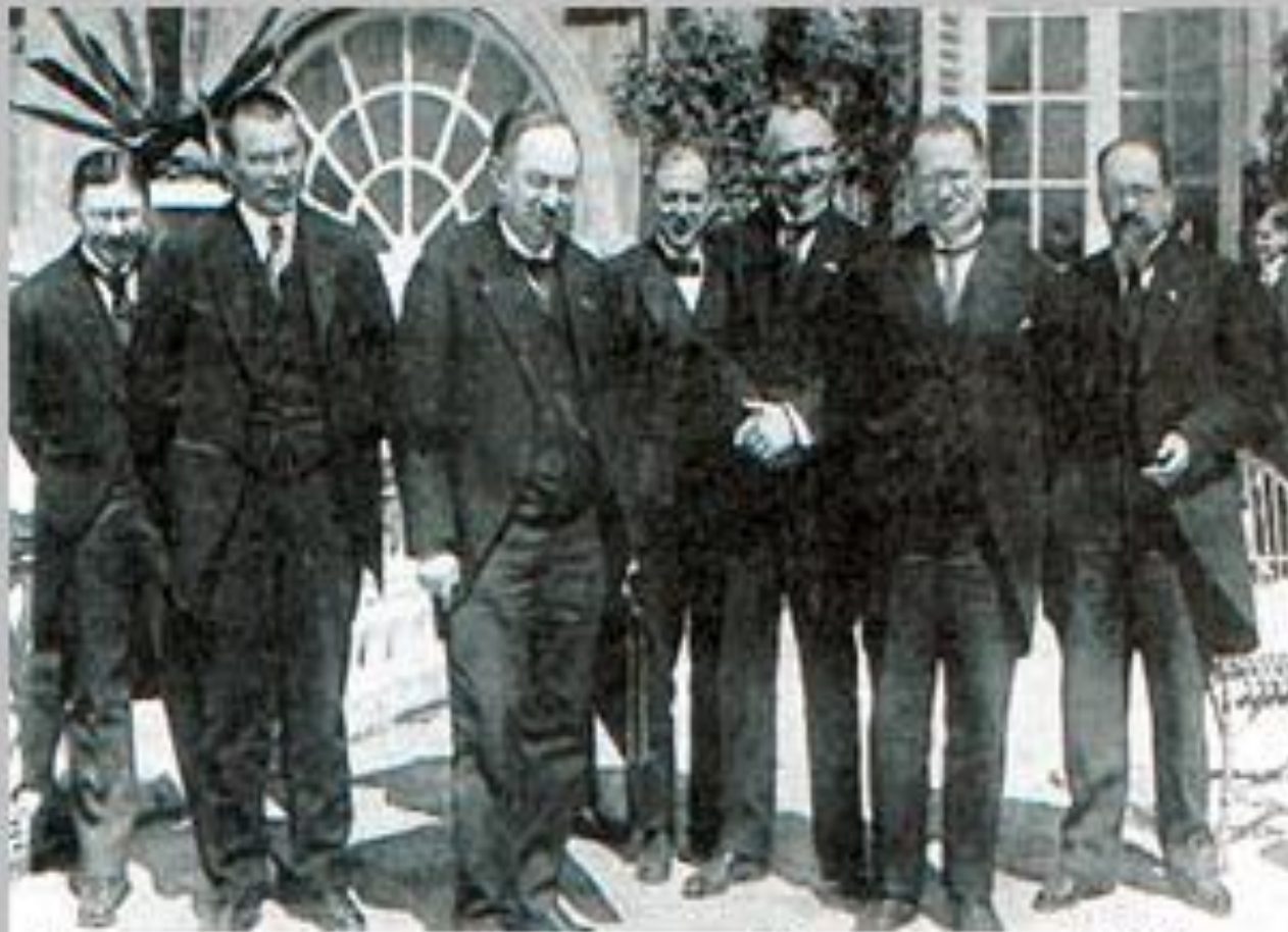
Генуэзская конференция. 10 апреля 1922 г.

РСФСР предложила сотрудничество между капиталистическими и социалистическими государствами в экономической, политической и культурной областях, невмешательства во внутренние дела, признания принципов ненападения, полного