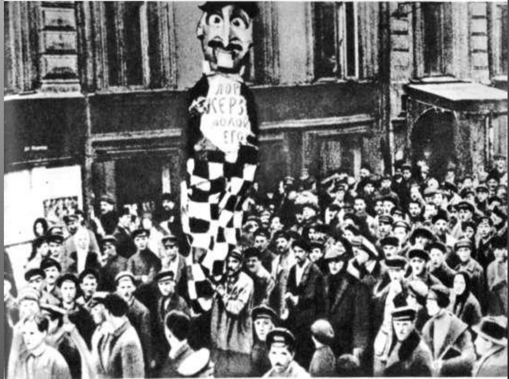
Демонстрация в Москве против ультиматума Керзона