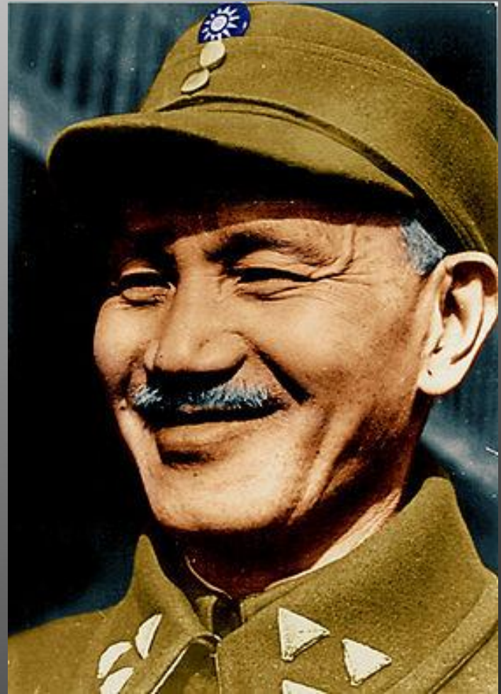
Чан Кайши в 1928 г. был избран президентом Китая.

В 1924 г. было подписано советско-китайское соглашение об установлении дипломатических отношений. Советское правительство отказывалось от всех привилегий царского правительства в Китае. Соглашение также предусматривало совместное управление советской и китайской администрацией на Китайско-Восточной железной дороге (КВЖД), построенной на русские деньги на китайской территории.