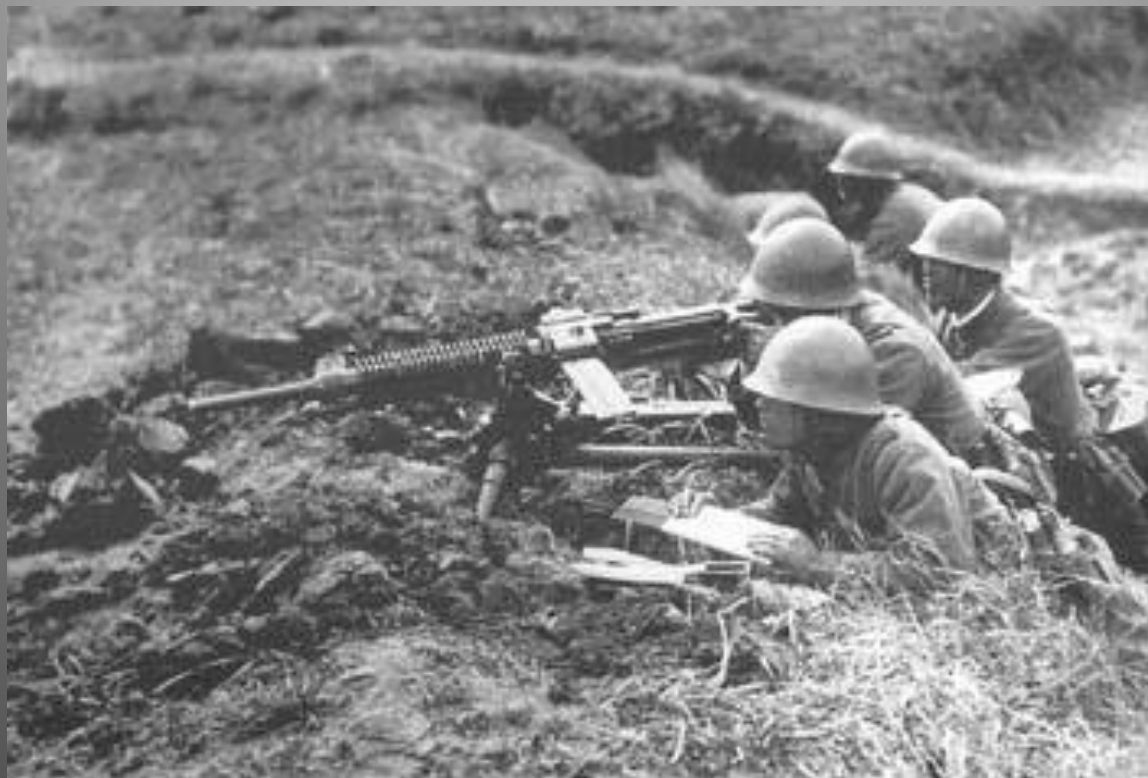
Бои у озера Хасан.