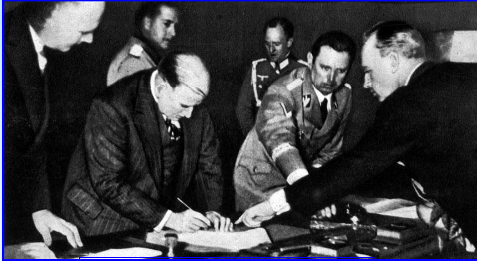
Подписание Мюнхенского договора