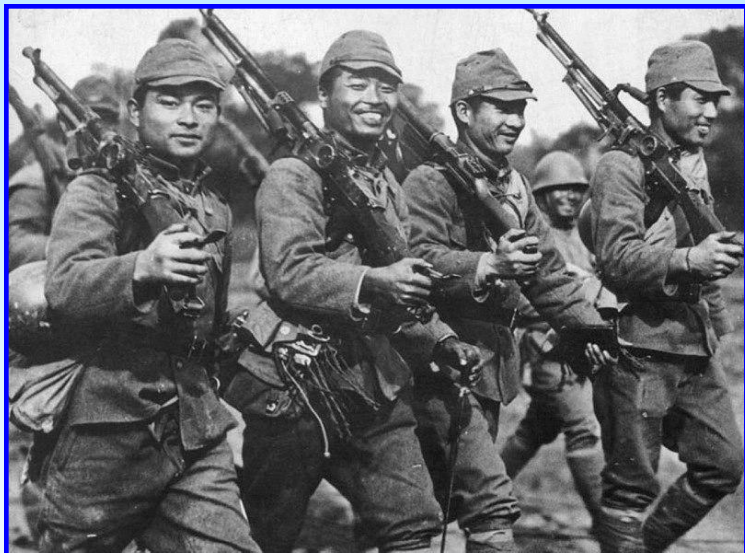
Японские солдаты в Китае