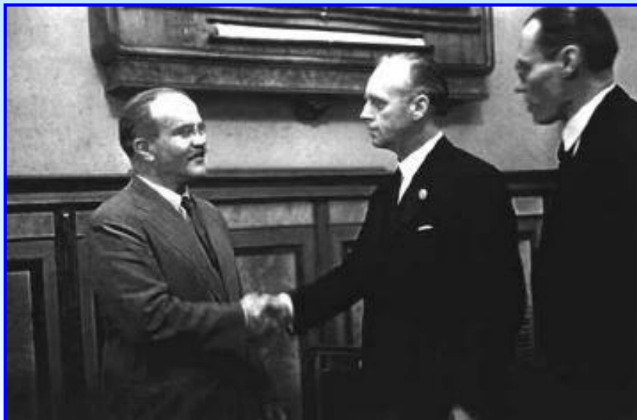
Молотов и Риббентроп 23 августа 1939 г.

Договор был выгоден обеим странам. Германия избегала войны на 2 фронта и создавала плацдарм для последующих действий на Востоке.