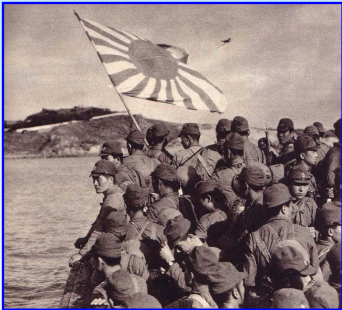
Высадка японского десанта