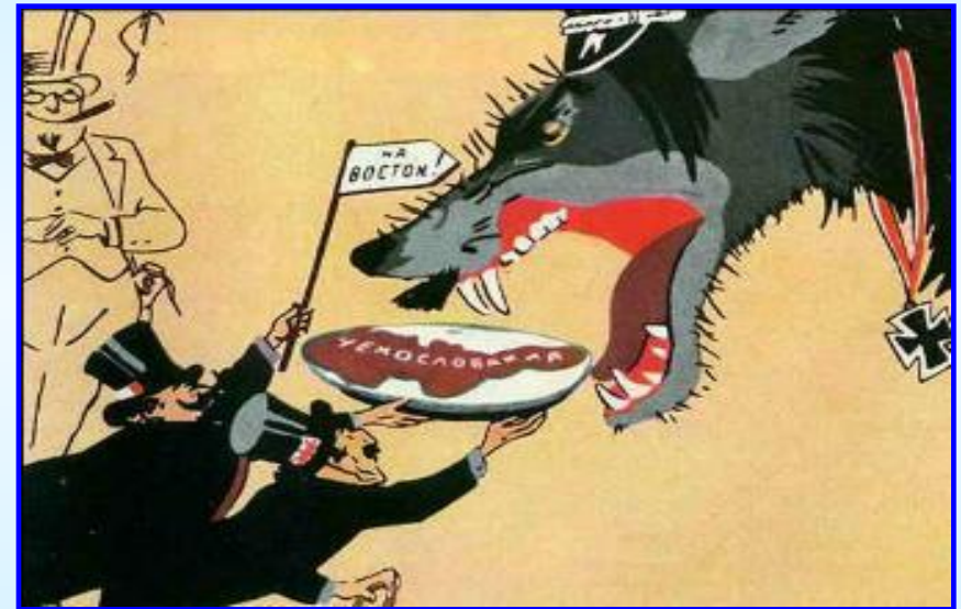
Советская карикатура на Мюнхенскую конференцию

СССР готов был оказать Чехословакии помощь, но ее руководство не захотело обратиться в Совет Лиги наций. Вскоре Германия, Англия и Франция подписали ряд деклараций и стало ясно, что создать систему коллективной безопасности в Европе не удастся.