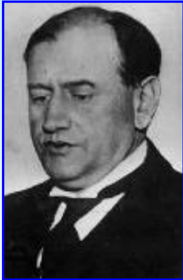
Премьер-министр Франции Деладье