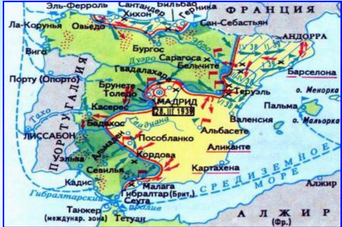
Гражданская война в Испании

Летом 1936 г. в Испании начался фашистский мятеж во главе с генералом Франко, в стране началась Гражданская война. Германия и Италия оказывали активную помощь франкистам, а Англия и Франция заняли позицию «невмешательства».