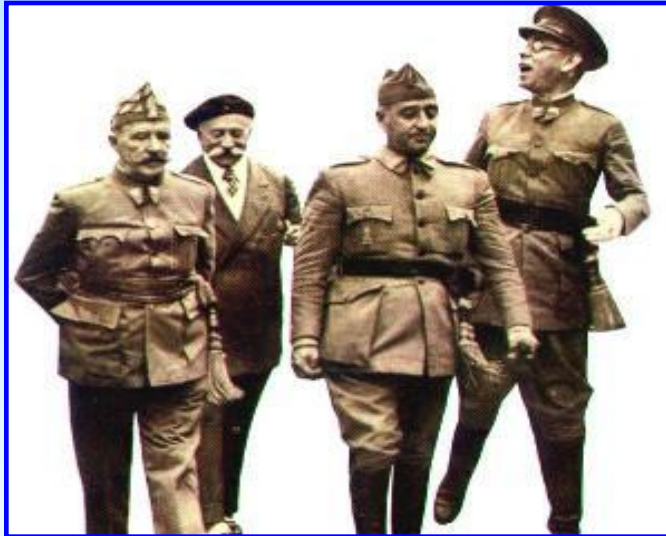
Генерал Ф.Франко (в центре) и его соратники