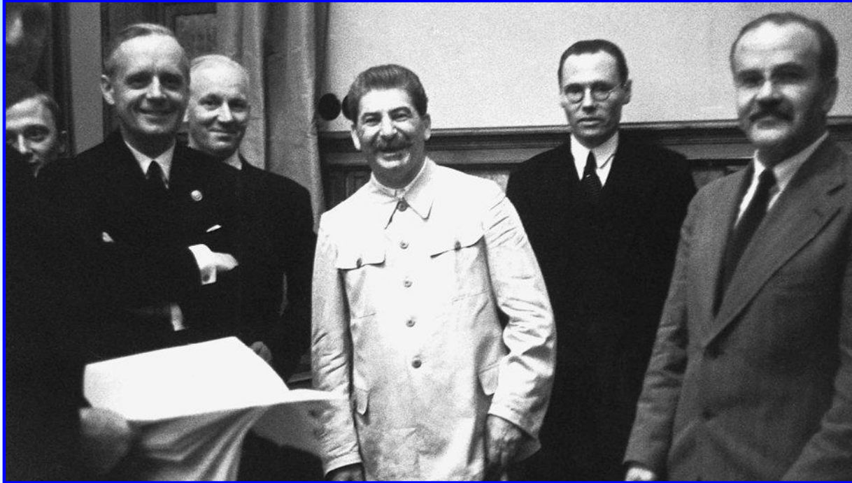
На советско-германских переговорах в Москве

Перед СССР вставала угроза возможной войны на два фронта (с Германией и с Японией). В этих условиях 23 августа 1939 г. был подписан советско-германский пакт о ненападении сроком на 10 лет. В приложении к нему содержались секретные протоколы, которые разделили Европу на сферы влияния между СССР и Германией. В сферу влияния СССР вошли Латвия, Эстония, Финляндия, Бессарабия; протокол оговаривал раздел Польши.