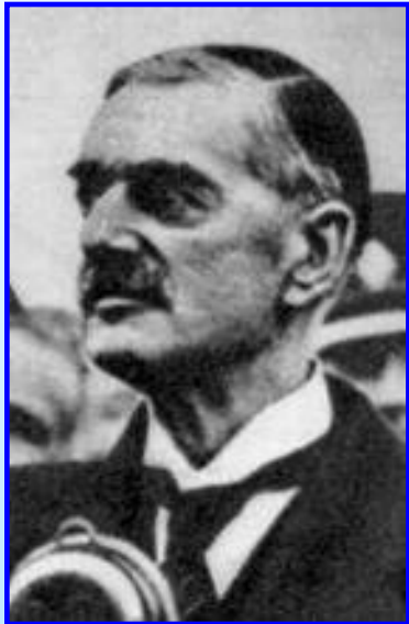
Премьер-министр Англии Чемберлен

После Мюнхенской конференции Англия и Франция провозгласили наступление «эры мира». В марте 1939 г. Гитлер ввел войска в Прагу и лишил Чехословакию независимости, захватил Мемельскую область принадлежавшую Литве. В апреле Италия захватила Албанию. После этих событий Англия и Франция пошли на переговоры с СССР. 12 августа их делегации прибыли в Москву, но они не обладали достаточными полномочиями. Советская сторона представила план совместных действий.