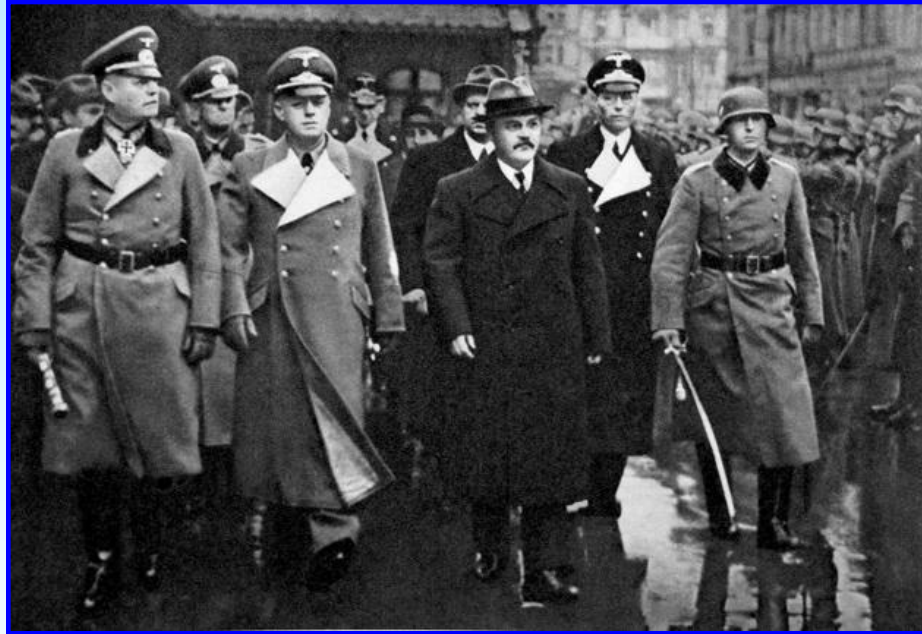
Визит В. Молотова в Берлин

В 30-е годы в связи с существенными изменениями политической ситуации в мире менялся и внешнеполитический курс СССР. Англия и Франция не пошли на создание совместно с СССР системы коллективной безопасности в Европе и СССР вынужден был пойти на сближение с главным агрессором – фашистской Германией.