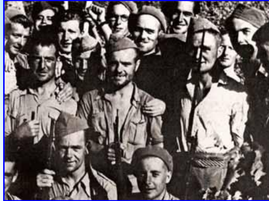
Бойцы интернациональных бригад

4 октября 1936 г. СССР заявил о своей поддержке Испанской республики; начались поставки военной техники, были отправлены 2 тыс. советников, а также значительное число добровольцев из числа военных специалистов. В Европе все больше осознавали опасность фашизма, но сотрудничать с СССР боялись.