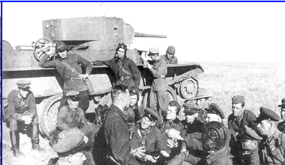
Бойцы Красной Армии у Халхин-Гола

Летом 1938 г. японцы попытались вторгнуться на советскую территорию у озера Хасан, но были отброшены.