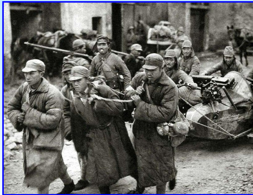
Бойцы китайской армии

В 1936 г. Германия и Япония заключили антикоминтерновский пакт (позже к нему присоединились Италия, Испания и Венгрия). В 1937 г. Япония начала полномасштабную агрессию против Китая и СССР начал оказывать ему материальную и техническую помощь. В боях на стороне китайской армии сражались советские инструкторы и летчики-добровольцы.