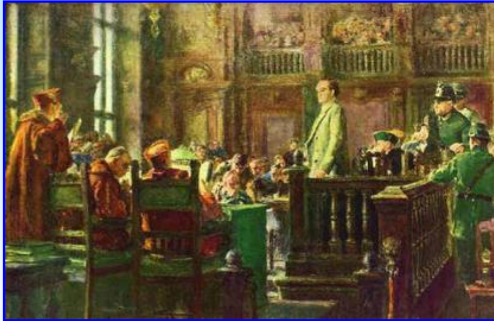
Г.Димитров на Лейпцигском процессе в 1933 г. (картина П. Михайлова)

Огромную роль во внешней политике СССР играл Коминтерн. До 1933 г. Сталин и Коминтерн считали своими главными врагами социал-демократов, называя их пособниками фашистов. В итоге к власти в Германии пришел Гитлер. В 1933 г. установки Коминтерна изменились. Этому способствовал Г. Димитров, выдвинувший идею создания «Единого антифашистского фронта». Это помогло предотвратить фашистский переворот во Франции и организовать помощь республиканской Испании.