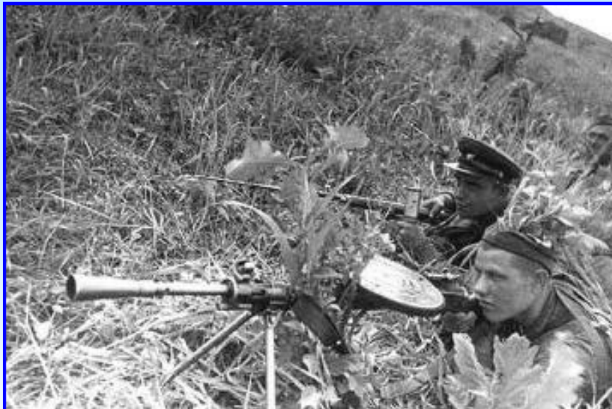
Красноармейцы у озера Хасан