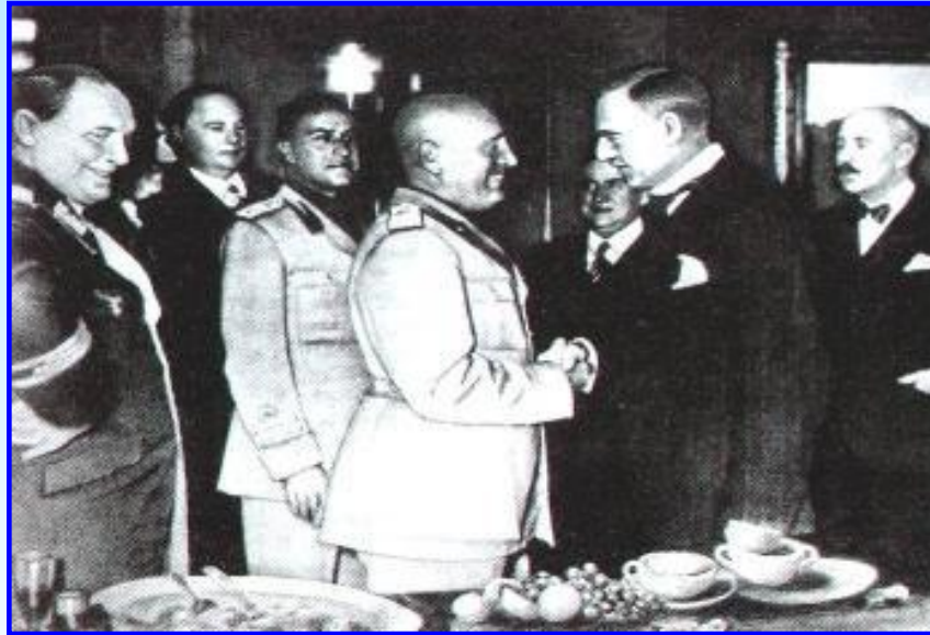
На Мюнхенской конференции

После возвращения в Лондон Чемберлен заявил: «Я привез вам мир». Его позиция объяснялась стремлением сохранить в Европе стабильность и верой в силу международного права. Деладье, в свою очередь, считал, что со всеми можно договориться, но оба лидера сами нарушали международное право, помогая душить Испанию и Чехословакию, подталкивая Гитлера к войне на Востоке. Позиция западных стран объяснялась боязнью военного укрепления СССР и желанием направить возможную агрессию Гитлера на Восток.