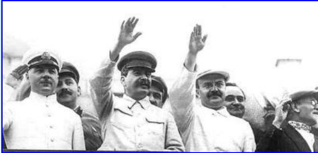
К.Е. Ворошилов (слева) – руководитель Советской делегации на переговорах

СССР был готов в случае начала войны в Европе выставить 136 дивизий, 5 тыс. орудий, 9-10 тыс. танков, 5-5,5 тыс. боевых самолетов. Англия готова была отправить на континент только 6 дивизий. Для ведения боевых действий Красная Армия должна была пройти через территории Польши и Румынии, но они не согласились. Делегации Англии и Франции начали затягивать переговоры. 18 августа К.Ворошилов в ультимативной форме потребовал подписать соглашение, но западные делегации отказались и переговоры были прекращены.