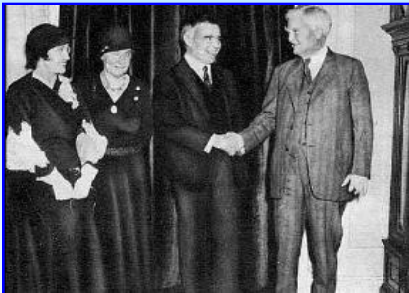
Советский полпред А.Трояновский и вице-президент США Гарднер

СССР возвратился в мировое сообщество в качестве великой державы, все споры вокруг царских долгов были решены в пользу Советского Союза. В мае 1935 г. был подписан советско-французский договор о военной взаимопомощи, вскоре к нему присоединилась Чехословакия. Но реальной силы этот альянс не имел, так как не содержал конкретных военных обязательств. В 1935 г. СССР выступил против милитаризации Рейнской зоны, осудил агрессию Италии против Эфиопии, но Лига наций нашу страну не поддержала.