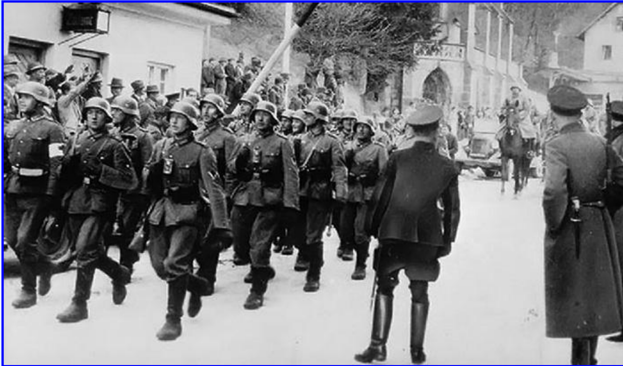
Немецкие войска в Вене

В марте 1938 г. состоялся аншлюс Австрии.