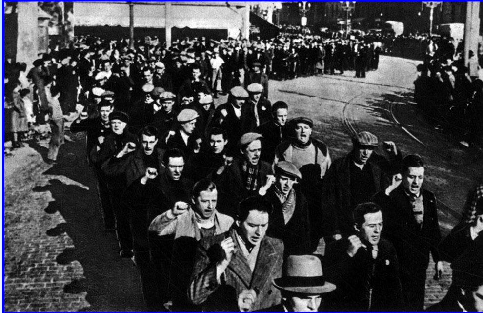
Добровольцы, прибывшие в Испанию