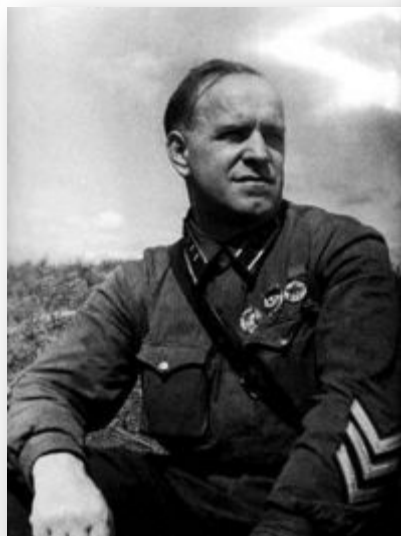
Комдив Г. Жуков на Халхин-Голе

СССР оказал военную помощь Монголии. Вооружённый конфликт, продолжавшийся с весны по осень 1939 года у реки Халхин-Гол на территории Монголии, закончился разгромом японских войск.