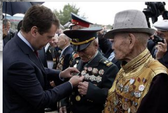
Д. А. Медведев вручает российские награды ветеранам Халхин-Гола (Улан-Батор, 2009)