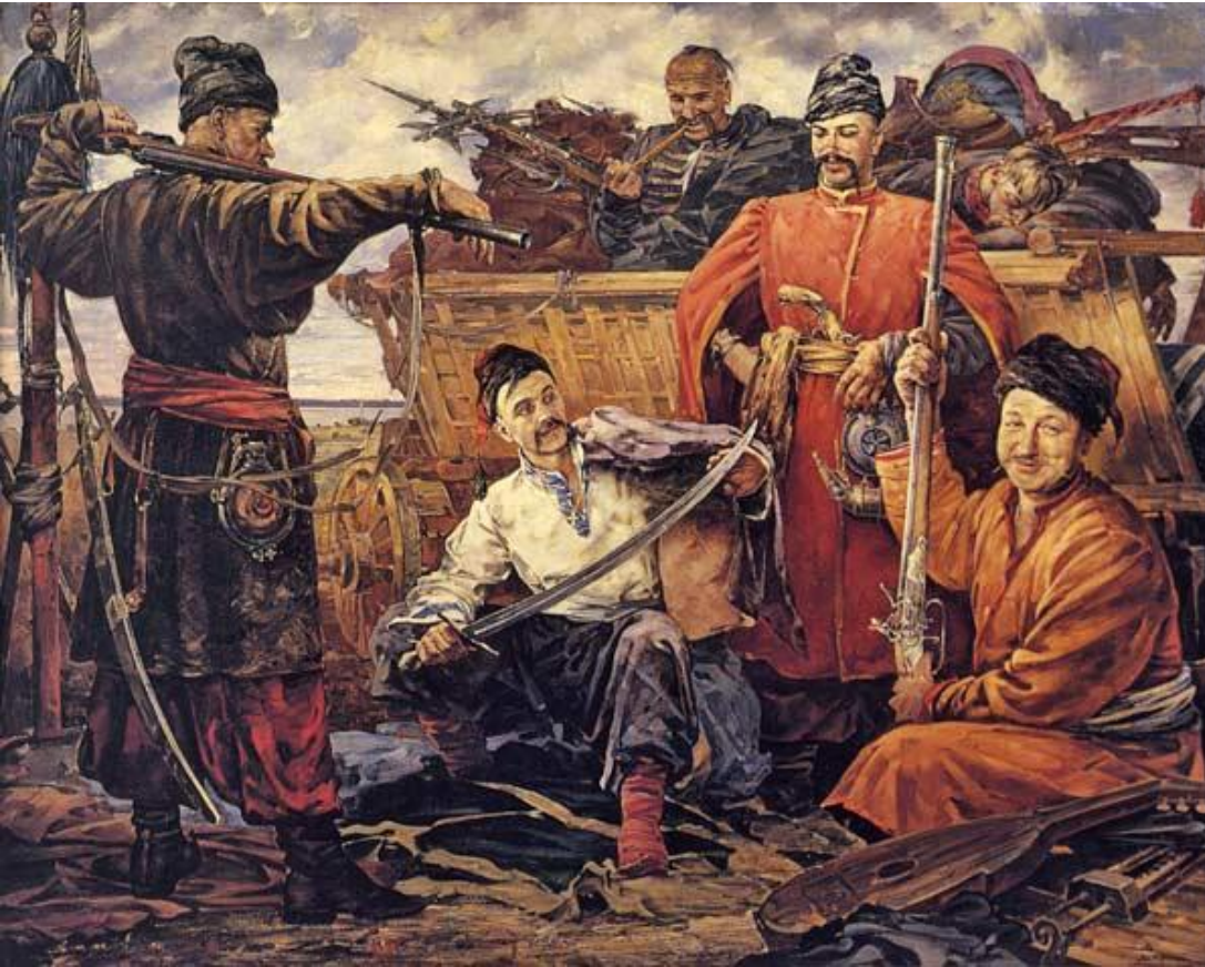
Запорожцы. Худ. В.Нестеренко.