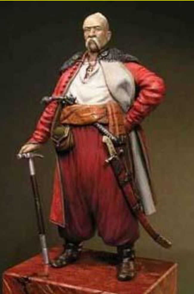
Украинский казак, представитель старшины, с пистолетом, саблей и боевым чеканом.