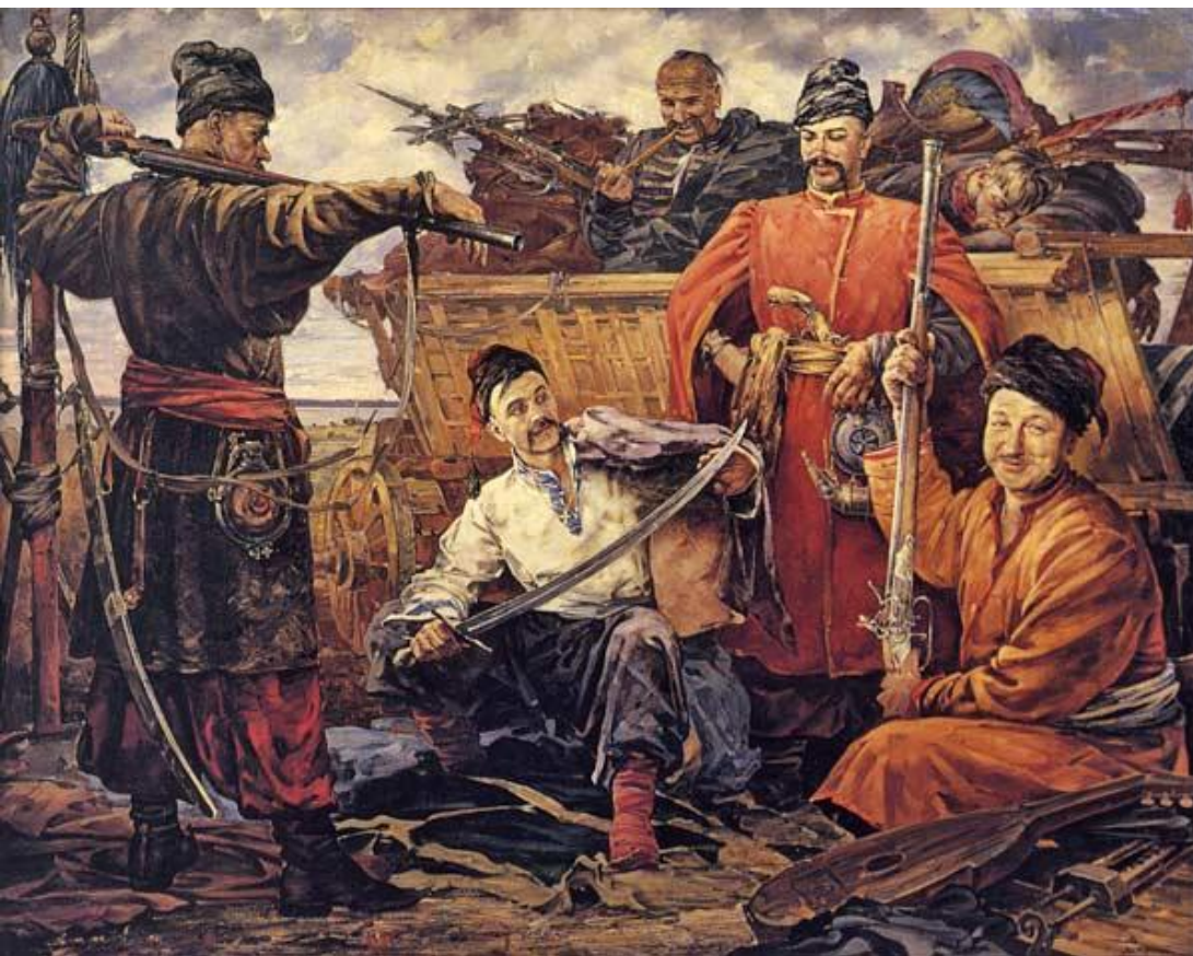
Запорожцы. Худ. В.Нестеренко.