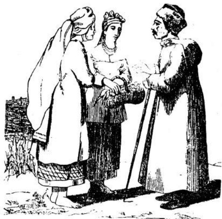
Одежда простолюдинов в Малороссии