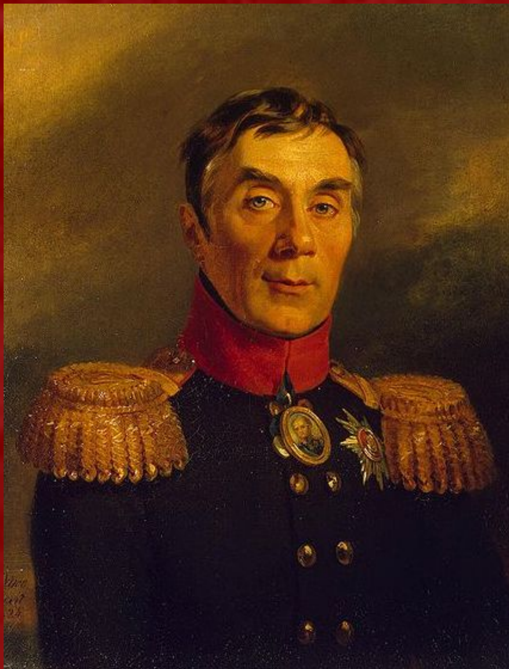
Алексей Андреевич Аракчеев