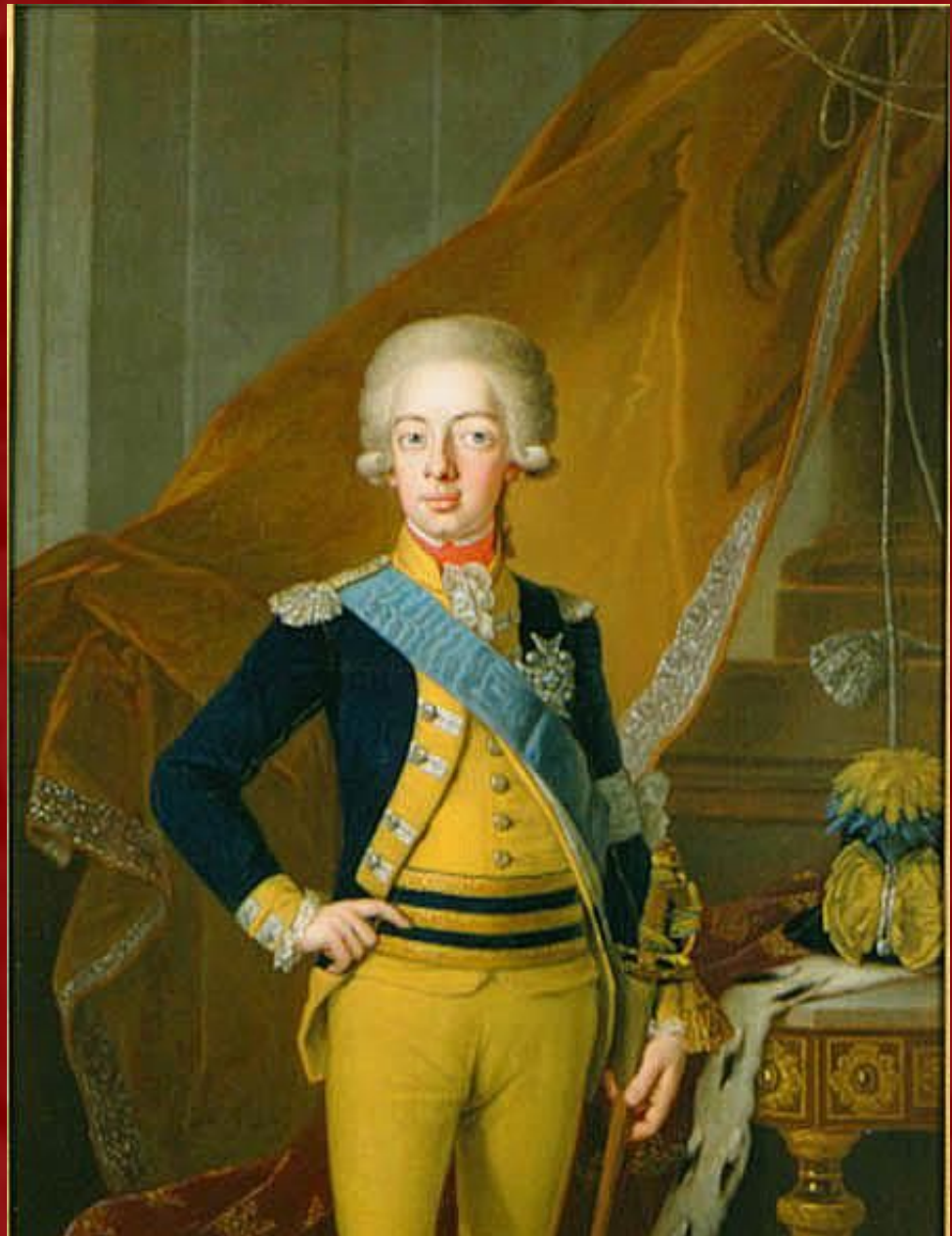
Густав IV Адольф Король Швеции, Готов и Вендов