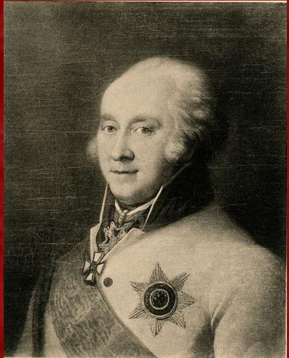
Иван Иванович Михельсон