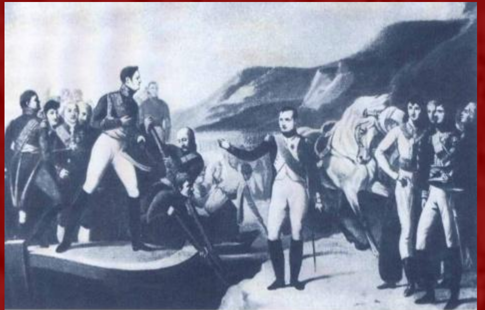
Александр I и Наполеон Бонапарт. Тильзитское свидание