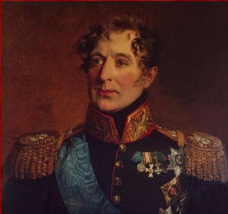
Михаил Андреевич Милорадович

Оно было заключено 12 августа 1807, сроком по 3 марта 1809 года. Русские войска должны были оставить княжества, Турции возвращались захваченные корабли и о.Тенедос. Турки обязались не вступать в княжества и прекратить военные действия в Сербии.