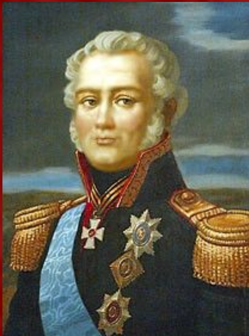
Фёдор Фёдорович Буксгевден

Тогда же стало известно, что шведский король готовится помогать Англии в войне с Данией, стремясь отвоевать у неё Норвегию. Все эти обстоятельства давали императору Александру I повод к покорению Финляндии, с целью обеспечения безопасности столицы от близкого соседства неприязненной России державы