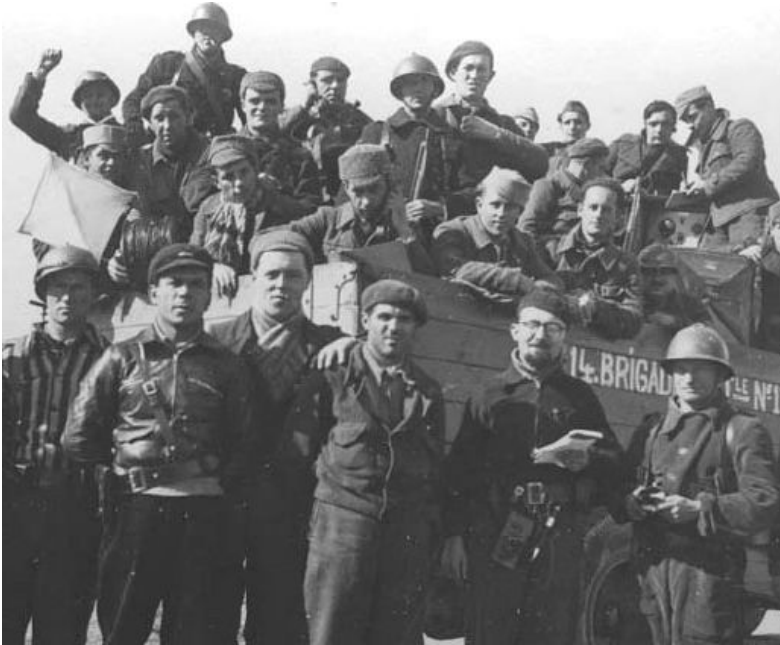
14 интернациональная бригада

В 1939 г. республиканское правительство Испании, сотрясаемое внутренними противоречиями, капитулировало перед мятежниками