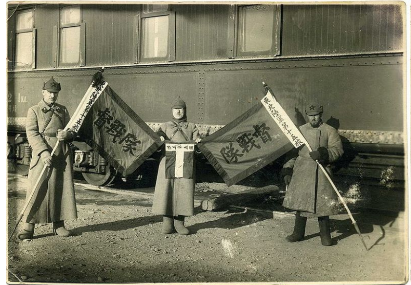
Захваченные китайские знамена

В 1928 г. к власти в Китае пришло правительство Чан Кайши, которое попыталось силой вернуть себе утраченные на КВЖД позиции