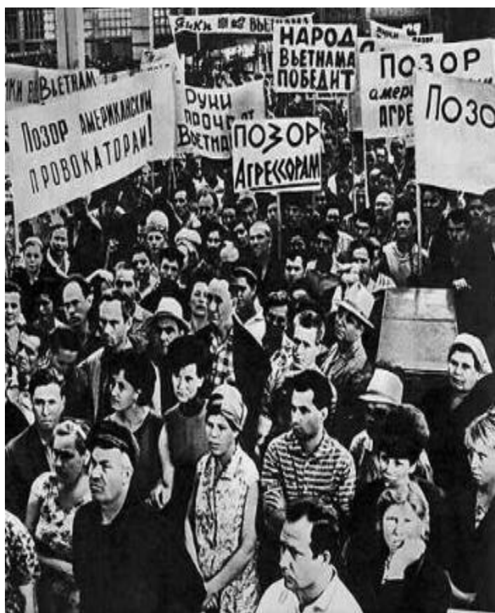
Митинг на АЗЛК против войны во Вьетнаме.

В сер.60-х гг.международная обстановка осложнилась. Война во Вьетнаме привела к обострению отношений СССР и США. Идеологические споры с Китаем привели к территориальным претензиям с его стороны и в 1969 г. произошел вооруженный конфликт из-за о.До манский. Критика сталинизма привела к конфликту с Китаем,Кореей и Албанией,а его «реабилитация» к спорам с компартиями Западной Европы.