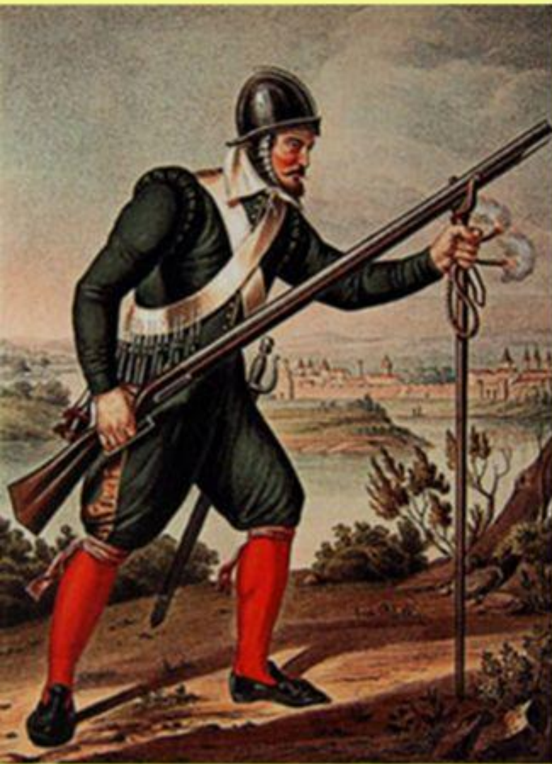
Мушкетер из полка «нового» (иноземного) строя

Во 2-й половине XVII в. в России появились полки «нового (иноземного) строя»: пешие (солдатские или мушкетерские) и конные (рейтарские).