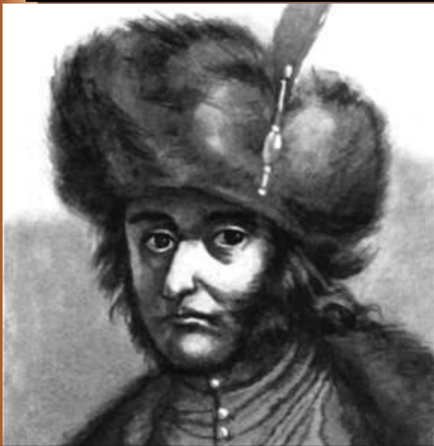
Лжедмитрий I – Григорий Отрепьев

Самозванец на самом деле происходил из мелких дворян, служил у бояр Романовых, а после ссылки постригся в монахи в Чудовом монастыре