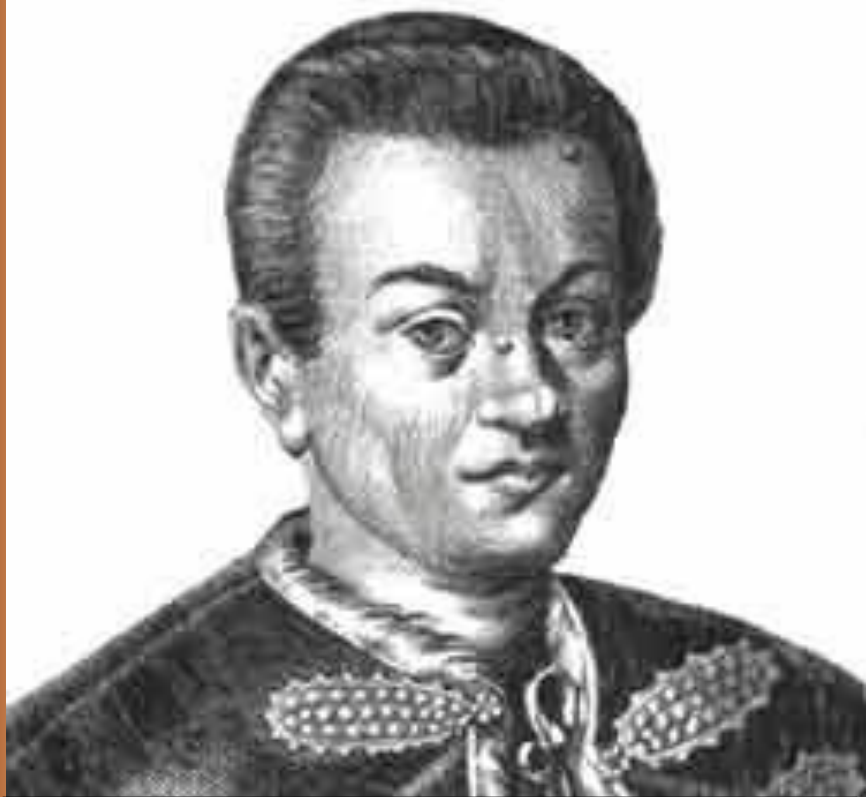
Лжедмитрий I – Григорий Отрепьев