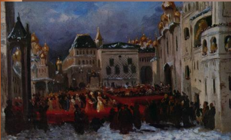
Москва времён Б. Годунова

С 1601 по 1603 годы были неурожайными, даже в летние месяцы не прекращались заморозки, а в сентябре выпадал снег. Разразился страшный голод, жертвами которого стало до полумиллиона человек. В Москве голод был особенно страшным