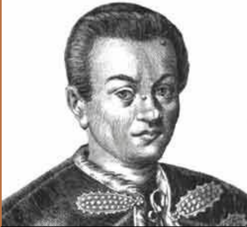
Лжедмитрий I – Григорий Отрепьев