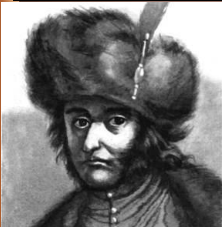
Лжедмитрий I – Григорий Отрепьев

Самозванец на самом деле происходил из мелких дворян, служил у бояр Романовых, а после ссылки постригся в монахи в Чудовом монастыре