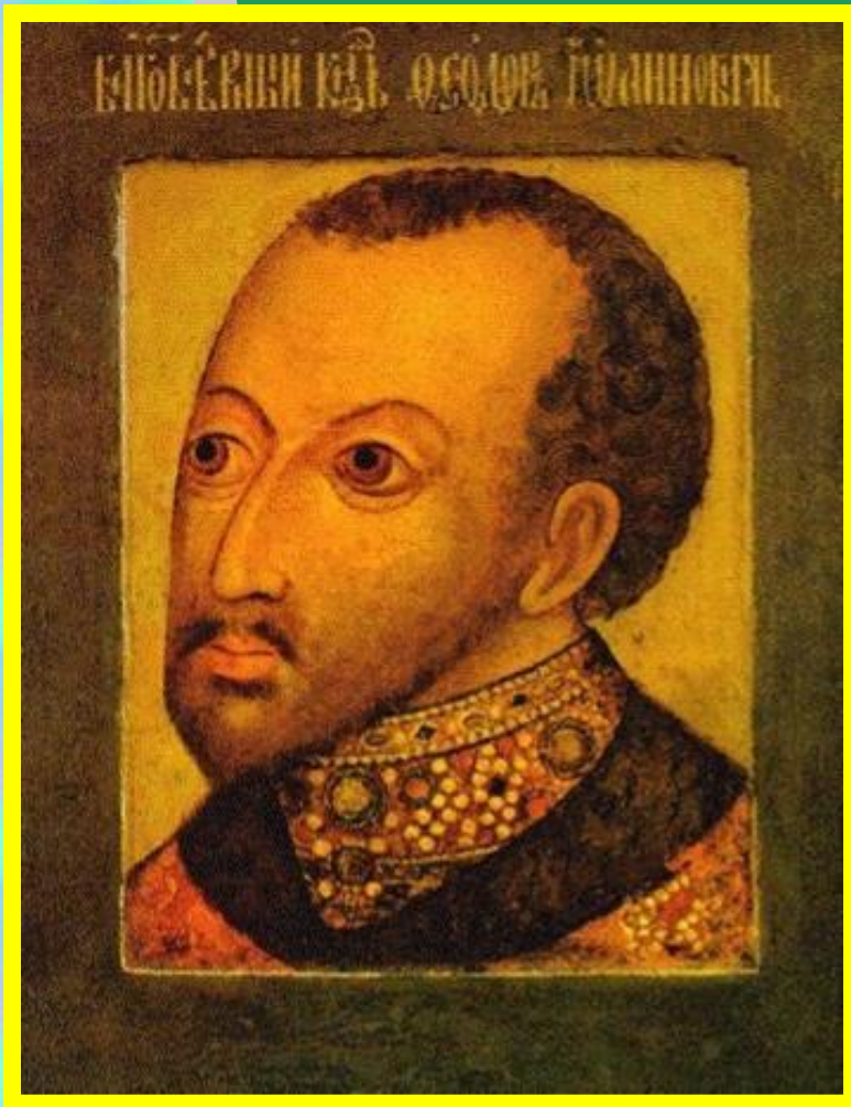
Царь Федор Иоанович Парсуна 17 в.

После смерти Ивана Грозного на престол взошел его болезненный сын- Федор . Фактическим правителем страны стал Борис Годунов - брат жены, царицы Ирины.