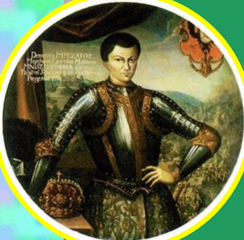
Лжедмитрий I. Миниатюра н. 17 в.

Заручившись поддержкой поляков (в обмен на Псков, Новгород, Новгород-Северский, Чернигов и брак с Мариной Мнишек), пообещав сделать Россию католической, он двинулся на Москву во главе небольшого отряда.