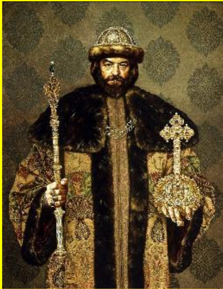
С.Присекин. Борис Годунов

Новым царем был избран Борис Годунов. Но он от казался занять престол.