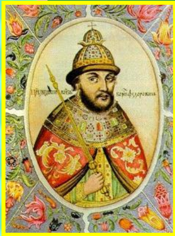
Борис Годунов. Миниатюра из «Титулярника».

Борис Годунов увеличил число «тяглых» людей в городах и в итоге размер тягла снизился.