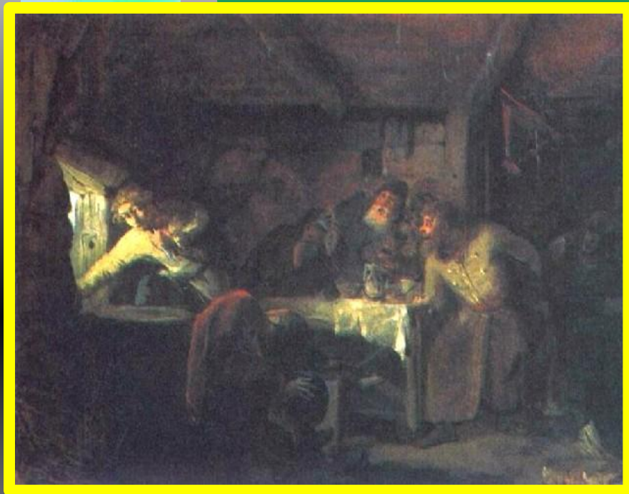
Бегство Гришки Отрепьева из корчмы на литовской границе. Худ. Г. Мясоедов

В 1604 г. в Литве объявился самозванец, называвший себя Дмитрием – беглый монах Чудова монастыря Григорий Отрепьев .