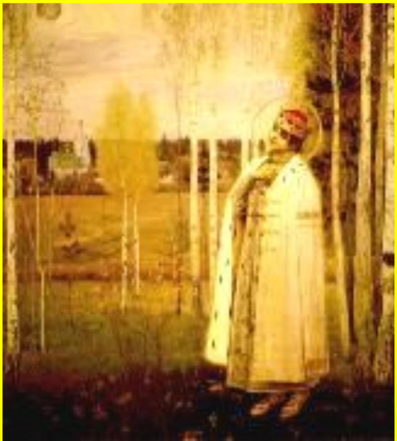
М.Нестеров. Убиенный царевич Дмитрий.

В 1591 г. в Угличе погиб младший сын Ивана Грозного 12-летний царевич Дмитрий . По стране пошли слухи, что его убили по приказу Годунова. Тот назначил комиссию во главе с В.Шуйским и она установила, что смерть - результат несчастного случая.