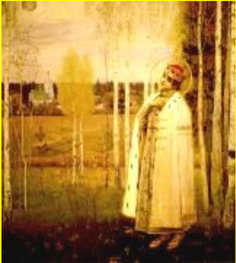
М.Нестеров. Убиенный царевич Дмитрий.

В 1591 г. в Угличе погиб младший сын Ивана Грозного 12-летний царевич Дмитрий . По стране пошли слухи, что его убили по приказу Годунова. Тот назначил комиссию во главе с В.Шуйским и она установила, что смерть - результат несчастного случая.