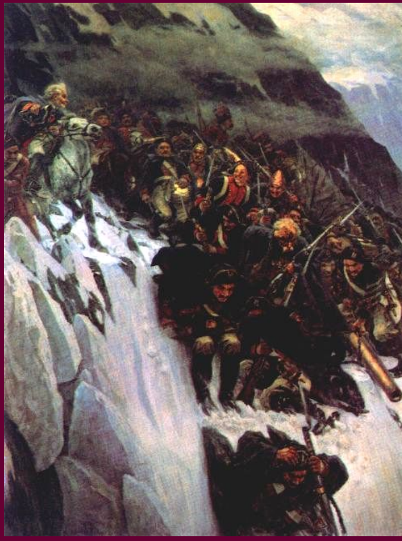
Переход Суворова через Альпы

Союзники России-Австрия и Англия, обеспокоенные успехами Суворова, потребовали чтобы Павел послал его в Швейцарию на помощь корпусу Римского-Корсакова.