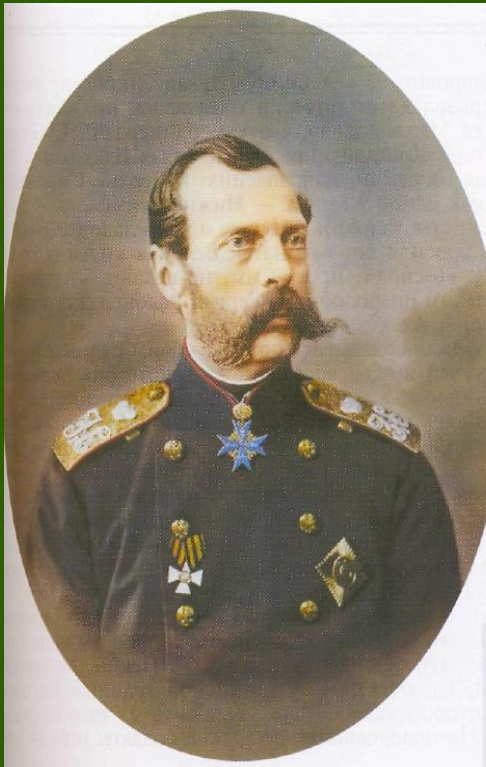
Александр II Годы правления 1855-1881

Манифест «О всемилостивейшем даровании крепостным людям прав состояния свободных сельских обывателей» и «Положение о крестьянах, вышедших из крепостной зависимости» (19 февраля 1861 г.):