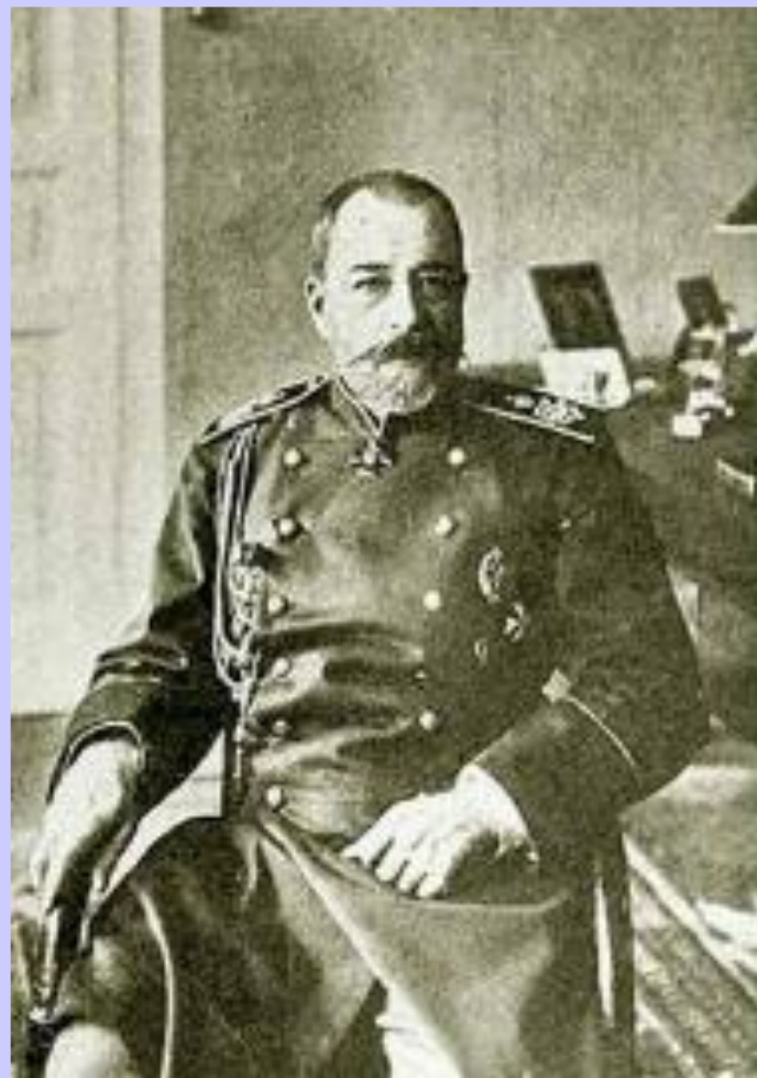
П. Д. Святополк- Мирский

В к. 1904 г. в записке царю он предложил план государственного переустройства - включить в Госсовет выборных от земств и дум, расширить круг избирателей и распространить земства на всю территорию России. Предполагалось постепенно уравнять крестьян в правах с другими сословиями и улучшить положение старообрядцев и инородцев. Николай издал указ о скорых преобразованиях, но до реальных мер дело не дошло.