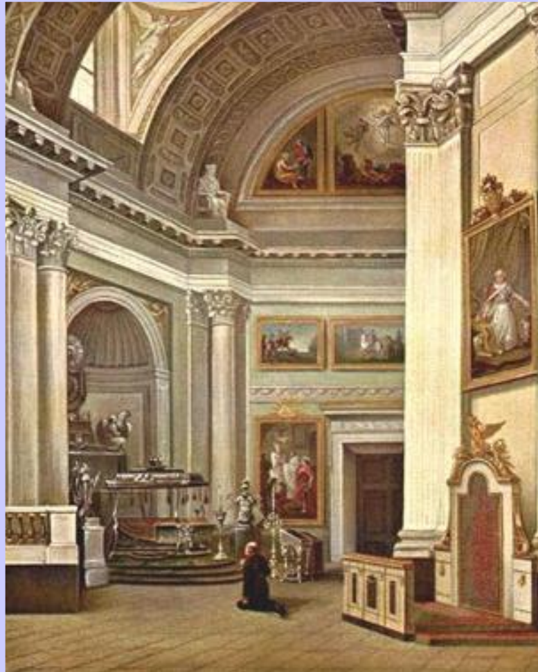
Александр I на молитве в Александро-Невской Лавре.

Причины неудачи реформ лежали в следующем: