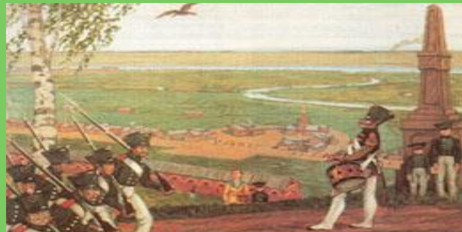
М. Добужинский. В военном поселении

А.А. Аракчеев «Без лести предан» («Бес лести предан»)