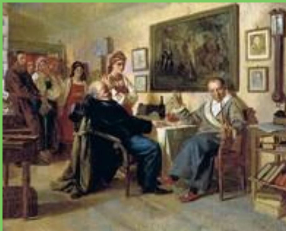
Торг Сцена из крепостного быта (Россия) (Художник Н.В. Неврев)