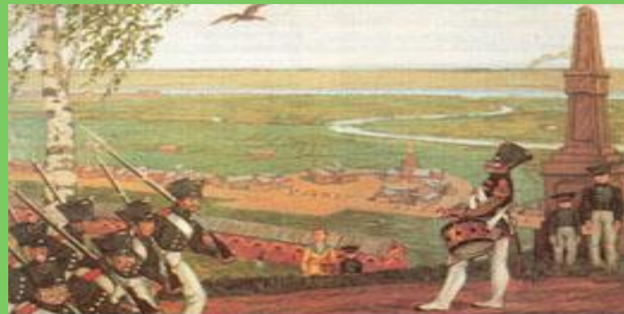
М. Добужинский. В военном поселении

А.А. Аракчеев «Без лести предан» («Бес лести предан»)