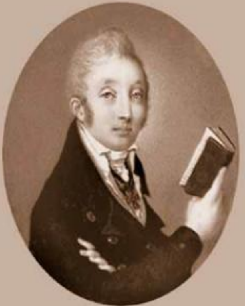
М.М. Сперанский в 1790-х гг.

Родился в 1772 г. в семье сельского священника. Учился во Владимирской духовной семинарии. В 1788 г. переведен в столичную Александро-Невскую семинарию.