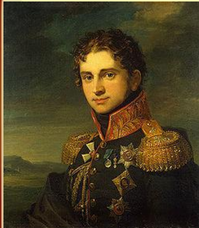
Павел Александрович Строганов