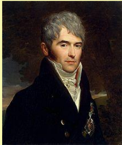
Виктор Павлович Кочубей