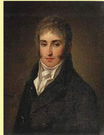
Адам Ежи Чарторыйский