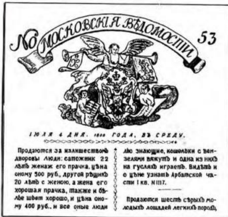
Объявление в газете о продаже крепостных

Одним из самых важных решений Александра стал указ от 20 февраля 1803 г. о «вольных хлебопашцах» , по которому помещики могли отпускать своих крепостных на волю с земельными наделами за выкуп. Это был первый в истории России закон, дававший возможность освобождения крестьян от крепостной зависимости