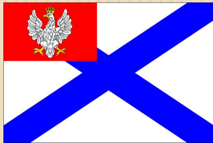
Флаг, герб и карта Царства Польского.