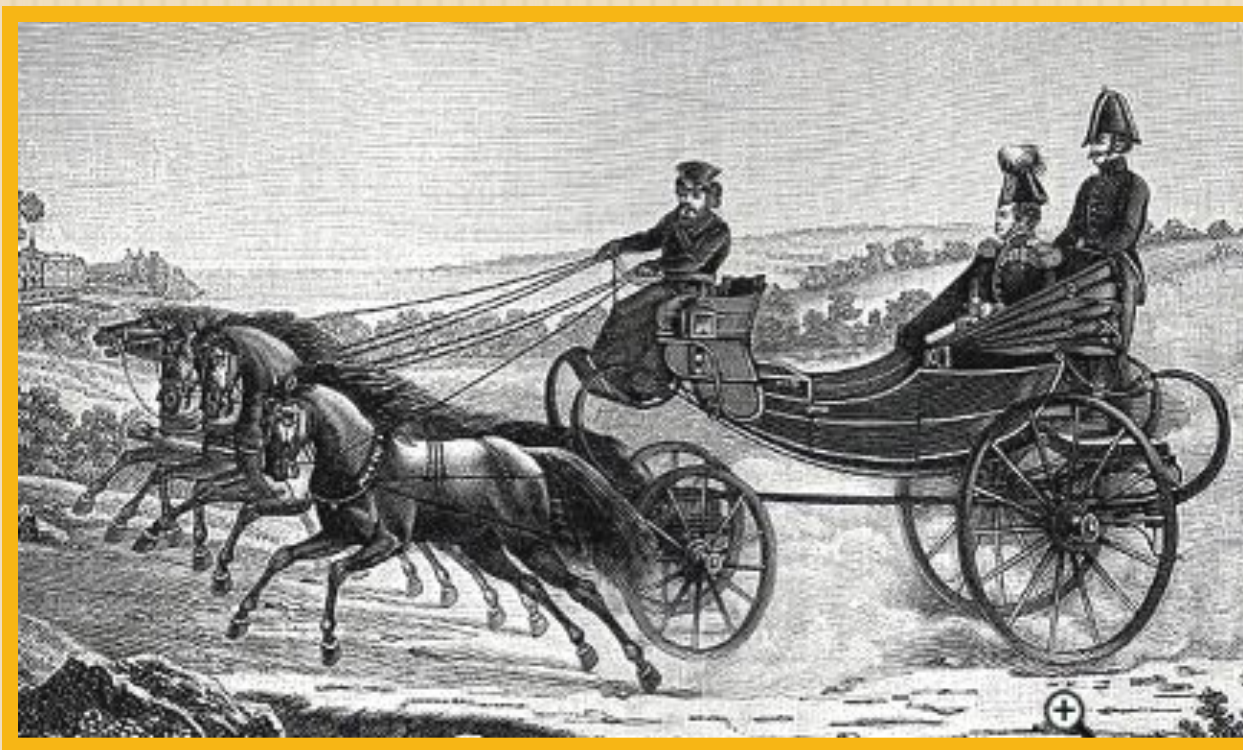
Александр 1 и Новосильцев на прогулке.

Несмотря на все эти идеи и проекты, подписаны они так и не были.