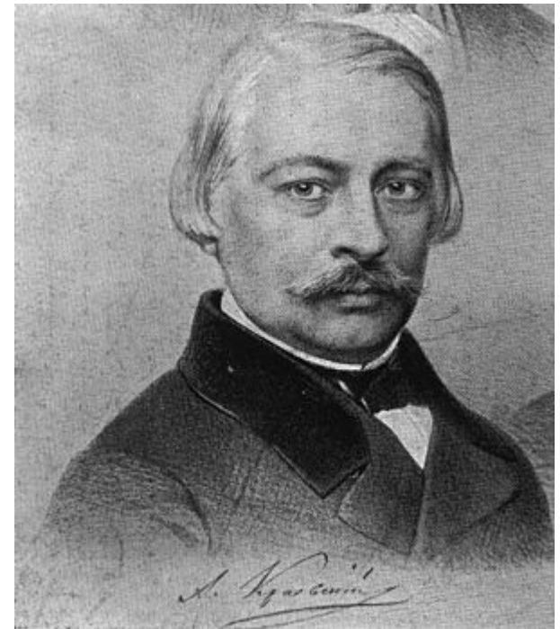
А. А. Краевский, гравированный портрет В. Ф. Тимма из «Русского художественного листка»

«Голос» А.А. Краевского «Отечественные записки М.Е. Салтыкова-Щедрина