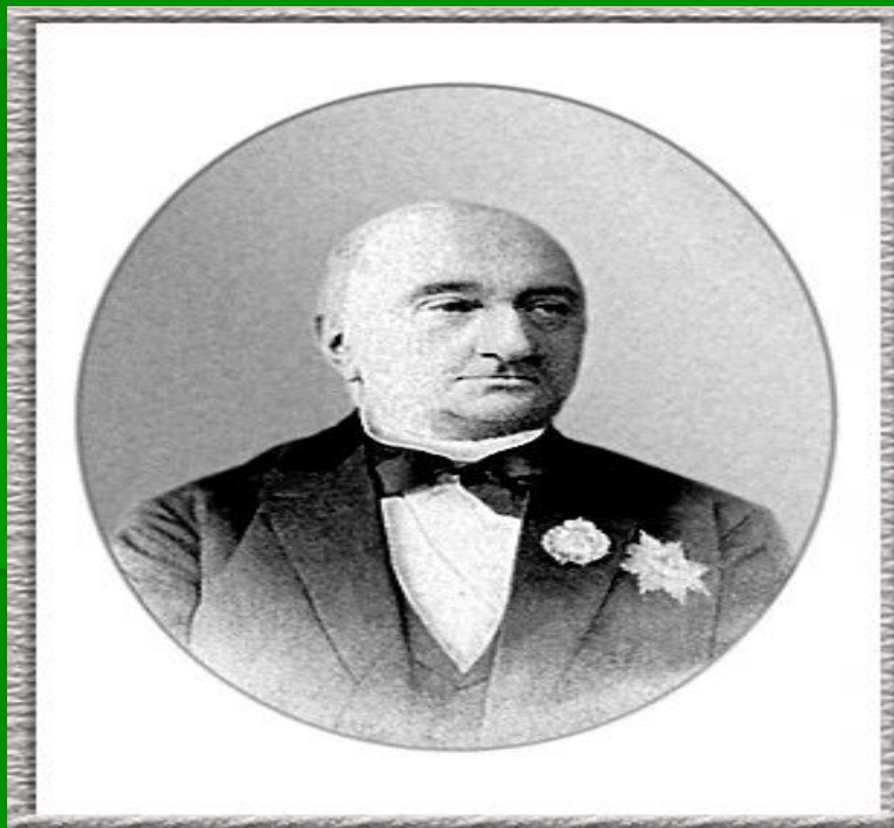
Иван Давыдович Делянов – министр народного просвещения