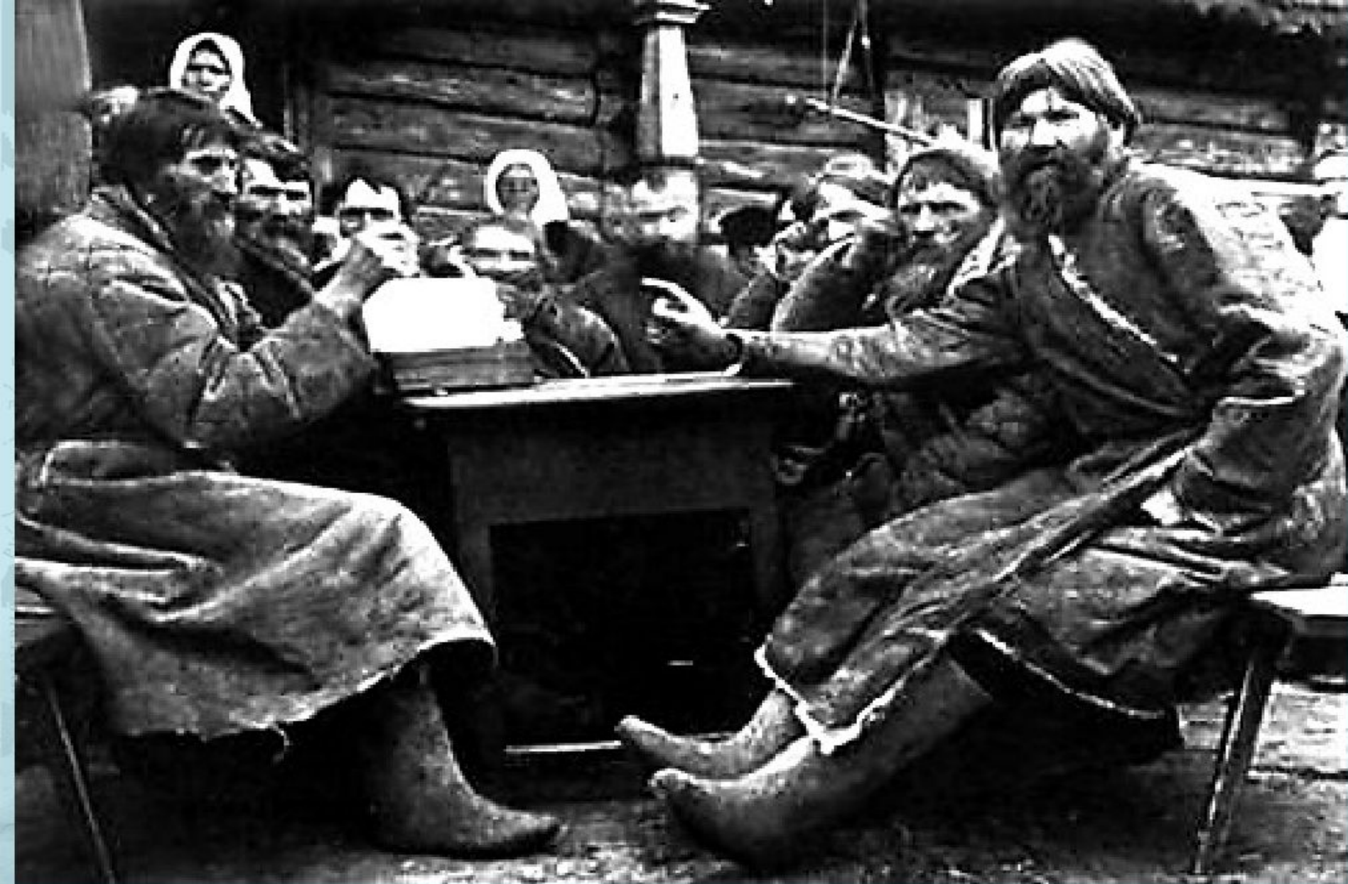
Сходка крестьянской общины во 2-ой половине XIX века.