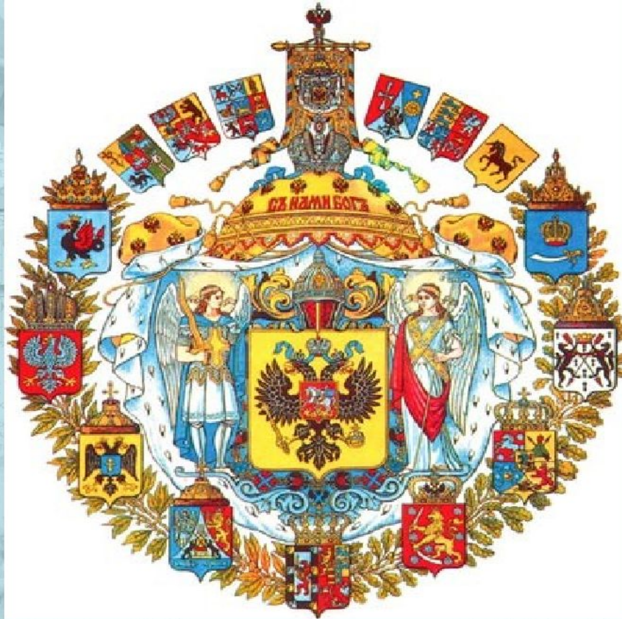
Большой герб Российской империи 1882 года.