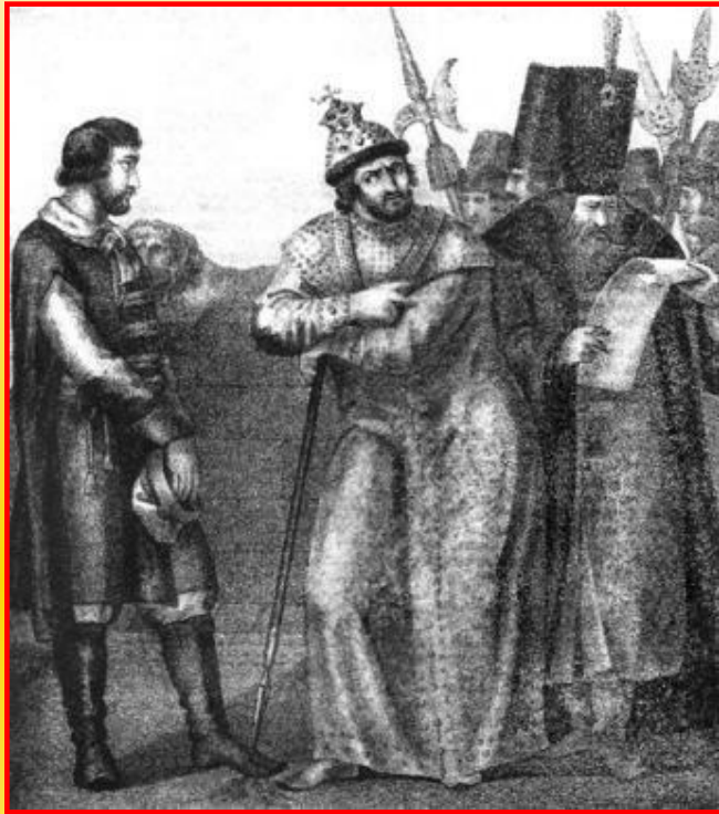
Иван IV выслушивает письмо от Курбского

В 1564 г. бежал в Литву А. Курбский. Начинается долгая переписка между ним и Иваном IV. Курбский упрекает царя в своеволии, небрежении советами бояр, казнях и преследованиях лучших людей, приводит в пример Польшу.