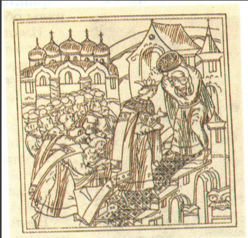
Обряд осыпания золотыми монетами царя Ивана IV после венчания на царство. Миниатюра.