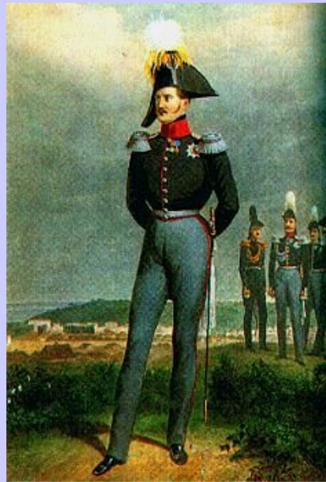
Николай I. Гравюра 19 в.

Для укрепления своей социальной опоры, Николай запретил дробить крупные имения при наследовании - они передавались старшему в роде.