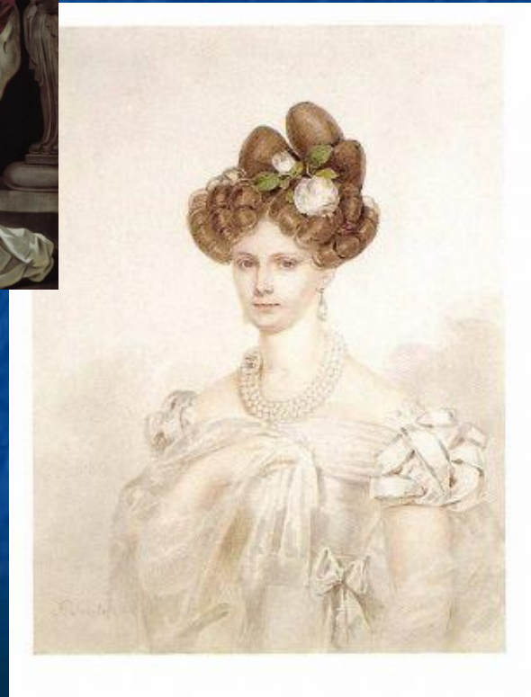
Императрица Александра Федоровна