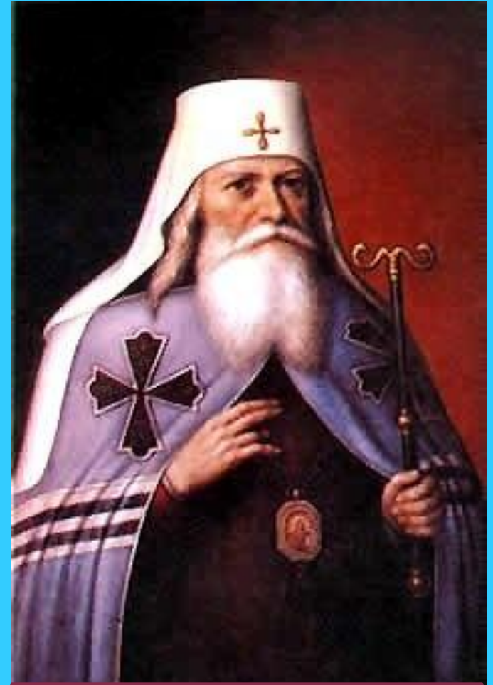
Адриан 1700 г

В 1721 г. патриаршество было ликвидировано, для управления церковью был создан "Святейший правительствующий Синод", или Духовная коллегия, также подчинявшаяся Сенату.