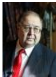
А.Усманов Металлоинвест $ 17,7млн.