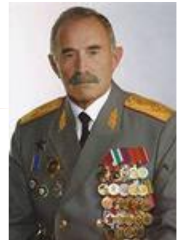
А.Аслаханов – депутат Госдумы от Чечни 2000-2003