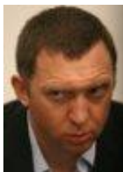
Олег Дерипаска Базовый элемент $ 18,6 млн.