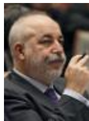
В.Вексельберг Ренова, ТНК ВР $ 13,4млн.