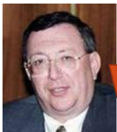
В.А. Гусинский НТВ

Банкротство НТВ, кадровые перестановки в ОРТ