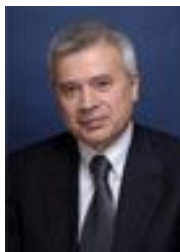
В.Алекперов НК Лукойл $ 13,9млн.