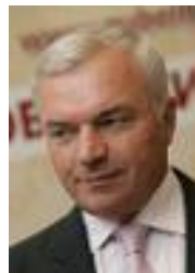
В.Рашников ММК $ 11,2млн.