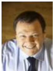
М.Фридман Альфа-Групп $ 15,1 млн.