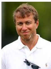
Р.Абрамович Инвестиции $ 13,4млн.