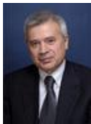
В.Алекперов НК Лукойл $ 13,9млн.