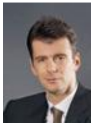
М.Прохоров ОНЭКСИМ $ 18 млн.