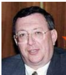
В.А. Гусинский НТВ

Банкротство НТВ, кадровые перестановки в ОРТ