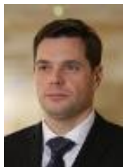
А.Мордашов Северсталь $ 18,5 млн.