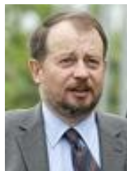
В.Лисин НЛМК $ 24млн.