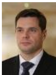
А.Мордашов Северсталь $ 18,5 млн.