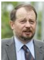
В.Лисин НЛМК $ 24млн.