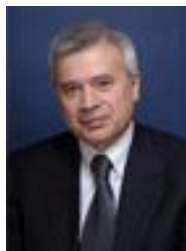
В.Алекперов НК Лукойл $ 13,9млн.