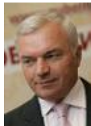
В.Рашников ММК $ 11,2млн.