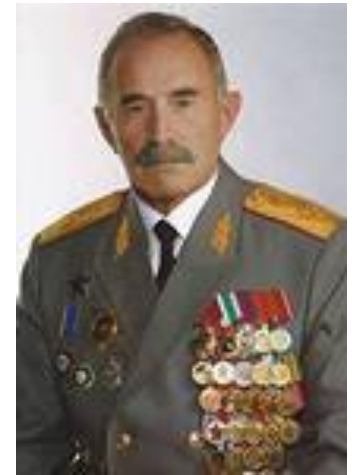
А.Аслаханов – депутат Госдумы от Чечни 2000-2003

В марте 2003 жители Чечни проголосовали за новую Конституцию, по которой Чечня Является частью России.