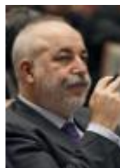
В.Вексельберг Ренова, ТНК ВР $ 13,4млн.