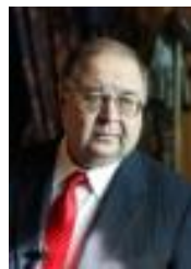
А.Усманов Металлоинвест $ 17,7млн.