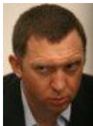
Олег Дерипаска Базовый элемент $ 18,6 млн.