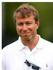
Р.Абрамович Инвестиции $ 13,4млн.