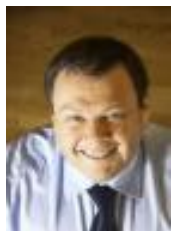
М.Фридман Альфа-Групп $ 15,1 млн.