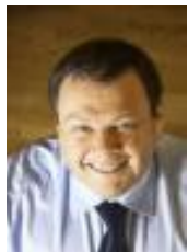
М.Фридман Альфа-Групп $ 15,1 млн.