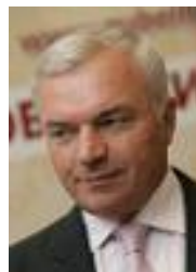
В.Рашников ММК $ 11,2млн.