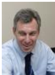
Хан Герман Альфа-Групп $ 9.6млн.