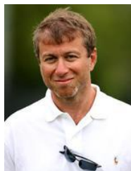
Р.Абрамович Инвестиции $ 13,4млн.