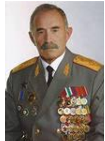
А.Аслаханов – депутат Госдумы от Чечни 2000-2003

В марте 2003 жители Чечни проголосовали за новую Конституцию, по которой Чечня Является частью России.