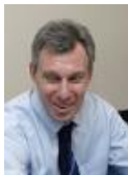
Хан Герман Альфа-Групп $ 9.6млн.