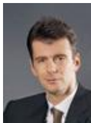
М.Прохоров ОНЭКСИМ $ 18 млн.