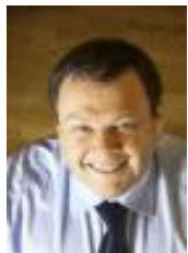
М.Фридман Альфа-Групп $ 15,1 млн.