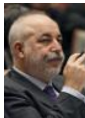
В.Вексельберг Ренова, ТНК ВР $ 13,4млн.