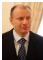
В.Потанин Интеррос $ 17,8 млн.