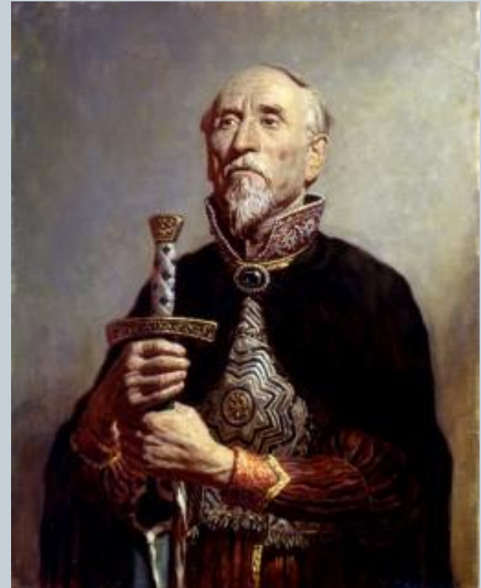
Русский воевода. Худ. С. Кириллов