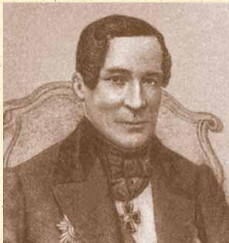
Константин Иванович Арсеньев