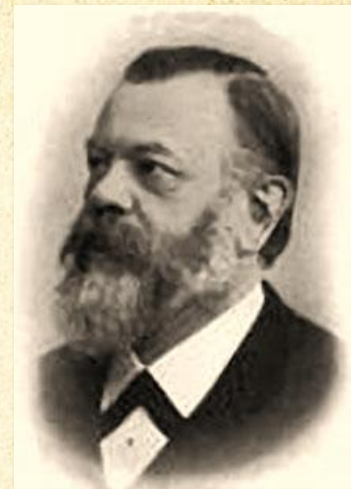
Карл Фёдорович Герман