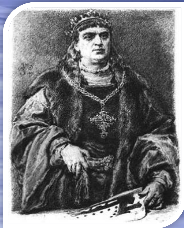
Сигизмунд I Старого

Сигизмунда 1 Старого с целью возвращения своей прежней роли в государстве.