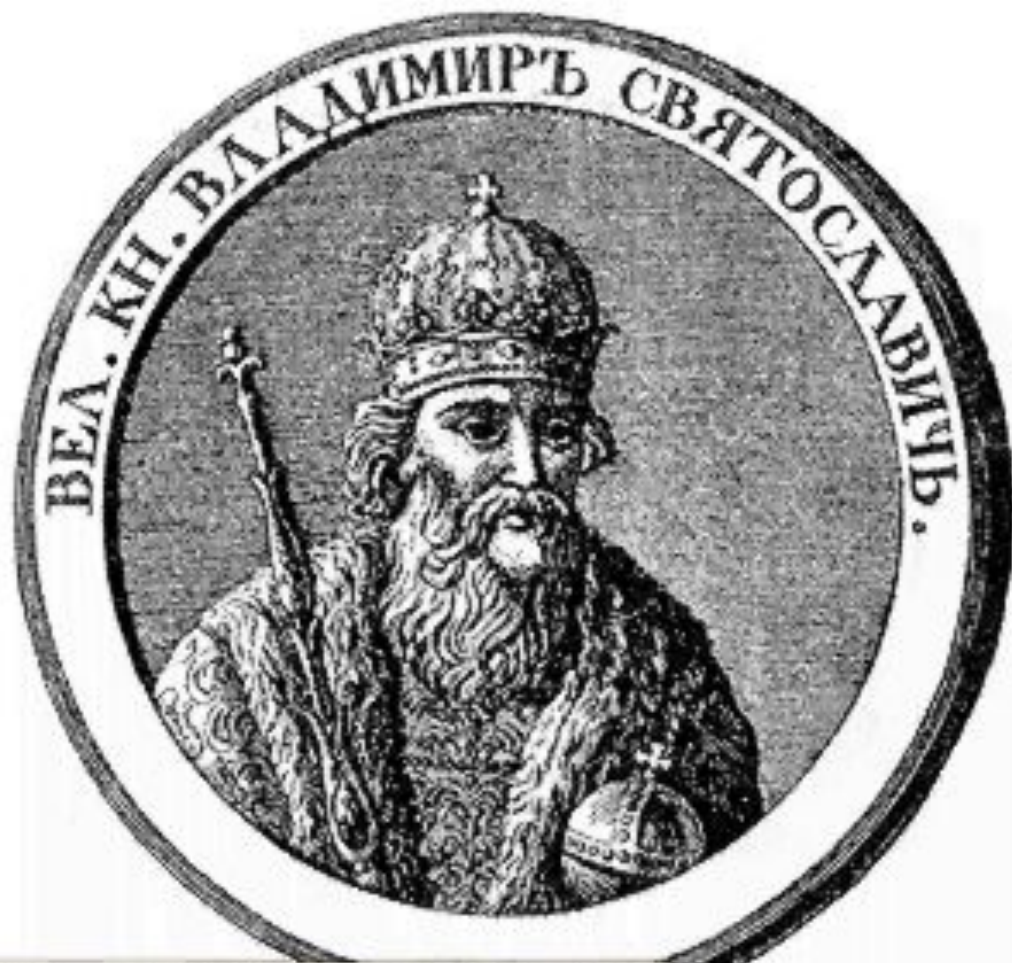
Владимир I Святой (980-1015 гг.)